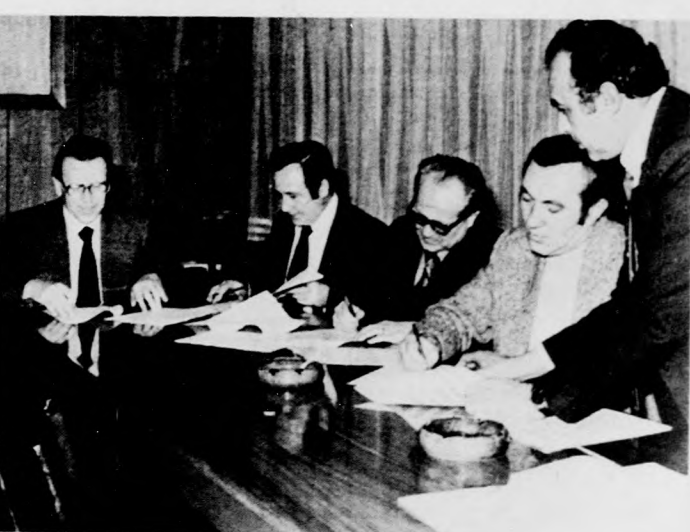
A Magyar Nemzeti Bank és a BIOGAL vezetői aláírják a több mint százmillió forintos új hitelt

A Magyar Nemzeti Bank hitelezési lehetőségeinek fokozásával a versenyképes export növelése áll a BIOGAL Gyógyszergyár most megkötött hitelszerződés, amelyet tegnap írtak alá, egy hosszabb távú exportfejlesztési koncepció második lépéséje, hiszen mint arról korábbi híradásunkban már részletesen szöveltünk, Hajdú-