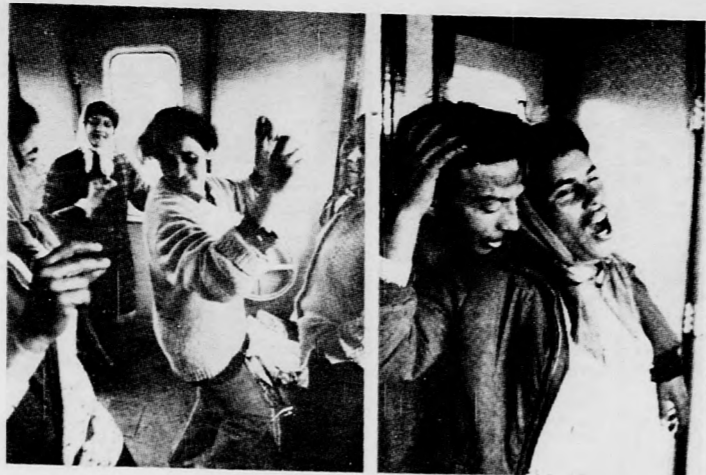
Vígsga a vonaton. Két kép a sorozatból

A képek között sétálva gyakran találkozunk a humorral. De sosem kipellengető, kegyetlen humorral, inkább együttérző megmosolyogtatással. Ez az együttérzés jelenik meg a Pedagógusok továbbképzése című képen, amelyen a néhány óra újra iskolapadba került tanító nének gyermeki örömet látjuk, amint büszkén nézegetik az elkészült papírfigurát.