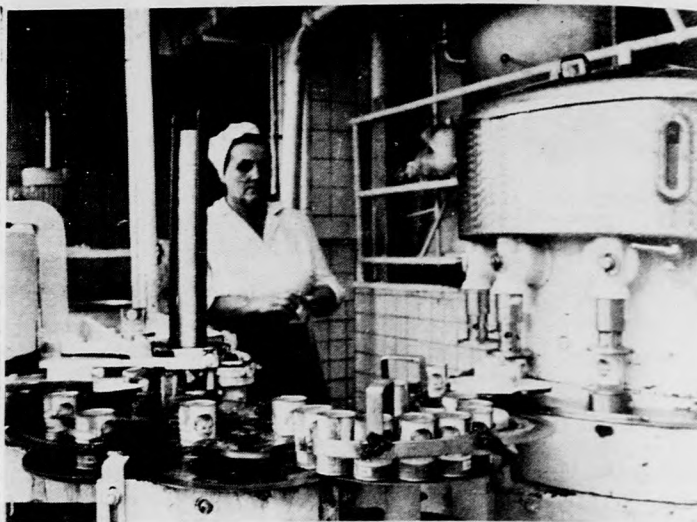
Tizennyolcféle készítményt gyárt az üzem

Dicsérendő, hogy az említett erőfeszítések mellett ju-