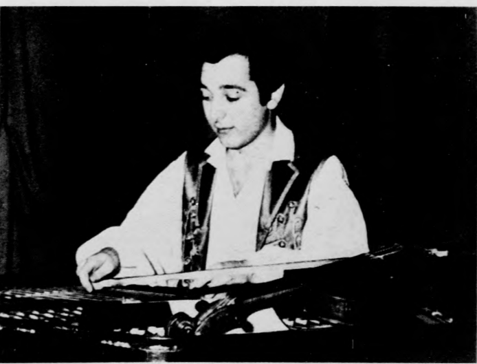
A zenekar cimbalmosa játszik

Január 27-én és 28-án két zenei kulturális esemény fogadta a hajdúszoboszlói Béke Gyógyüdülő vendégeit. Szombaton a KISZ Központi Művészegyesületének rajkőzenekara és tánckara lépett fel nagy sikerrel, vasárnap pedig a Liszt Ferenc Zeneművészeti Főiskola tanárai adtak emlékeztető hangversenyt.