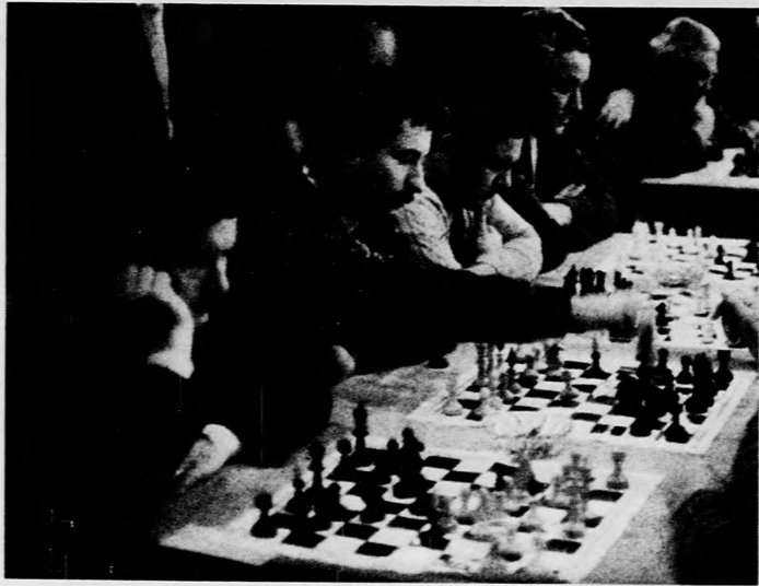
A harminc együttes közül a komádi Bihar Népe Termelőszövetkezet csapata szerepelt a legjobban a tízfordulós versenyen