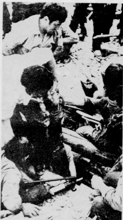
Mentés a romok alól

sek, közművek nagymérvű rombolódása; a lakóterületek részleges vagy teljes pusztulása; számtalan emberi áldozat; az elhullott állati tetemek a romok között stb. Jelentősek a másodlagos