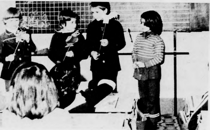
Pihenés és tanulás. Szabad foglalkozáson a napköziben