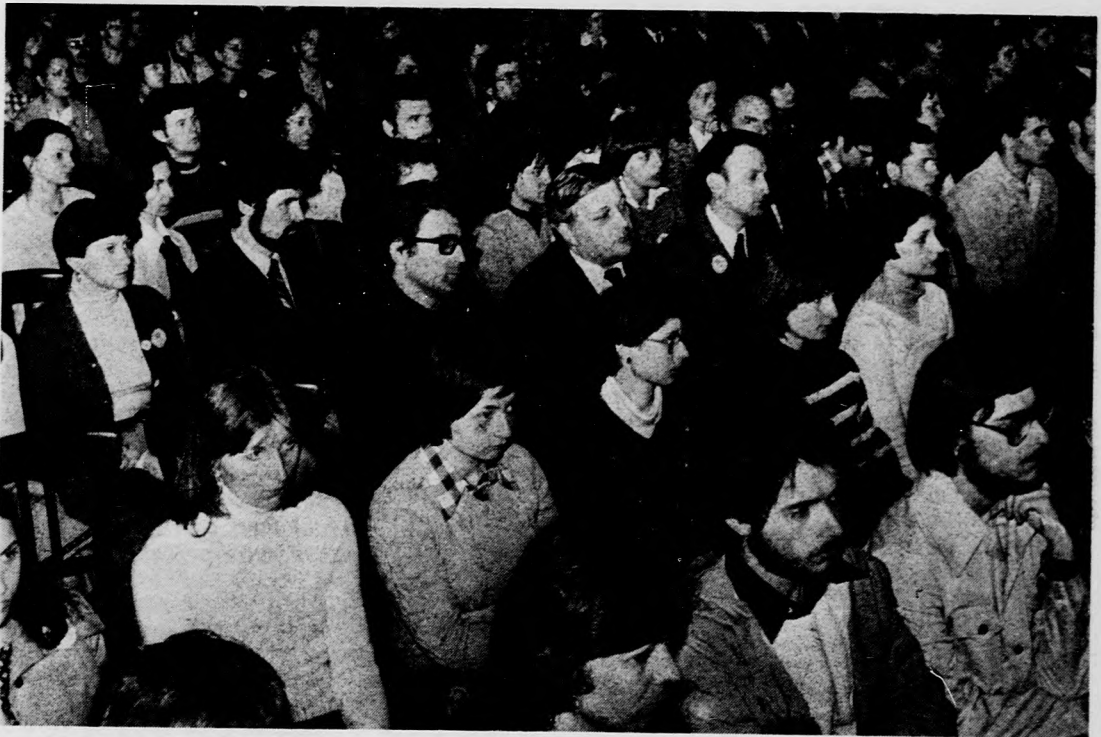
Tanárok és diákok a megnyitón

Ma délelőtt és délután folytatódnak a szekcióülések, majd 18 órától az alszekciók zsűrielnökeinek tanácskozási tartják meg 19 órától közös kulturális rendezvényre hivatalosak a konferencia vendégei.