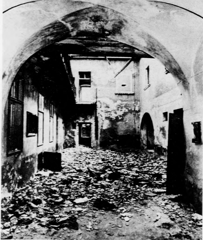
A példa nem követendő!

Panaszkodunk országjáró kulturánk hiányáról lépten- nyomon, s noha a múzeumok látogatottságát tekintve igen előkelő helyet foglalunk el a nemzetközi statisztikában (ta- valy tizenhétmillió érdeklő- dőt számláltak össze), ami műemlékeink ismeretét, múlt- tunk, építészeti és népraj- zunk tárgyi emlékeit, haj- dani társadalmi berendezke- désük hírmondóit illeti, még korántsem lehetünk elége- dettek.