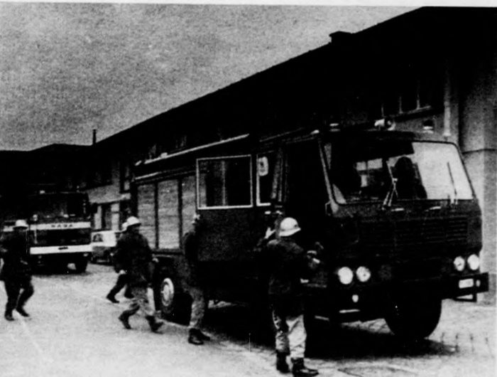
Éjszaka a tűzoltókocsiknak száz másodpercen belül el kell hagyniuk a laktanyát