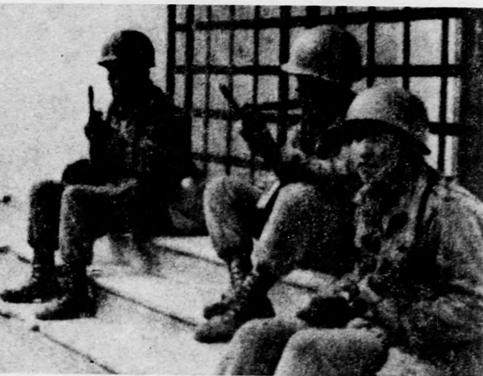
Bolívia fővárosában a hadsereg továbbra is ellenőrzése alatt tartja a legfontosabb középületeket annak ellenére, hogy a puccsisták vezetői és a polgári erők között meg egyezés született

Natusch Busch kilátásba helyezte, hogy az új junta létrejötte esetén az eredeti-