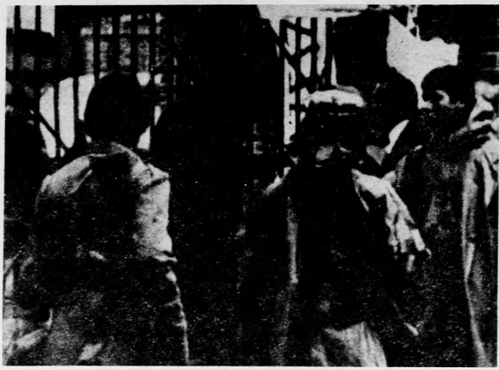
A teheráni amerikai nagykövetségen tovább tart a tűzdráma. Képünkön: géppisztolyokkal felfegyverzett iráni fiatalok, akik az „imám híveinek” nevezik magukat, őrzik az USA képviseletének épületét

Washington, amely a jelentések szerint minden lehetőséget megpróbál annak érdekében, hogy mintegy 60 állam-polgárára kiszabadulhasson a teheráni nagykövetségről.