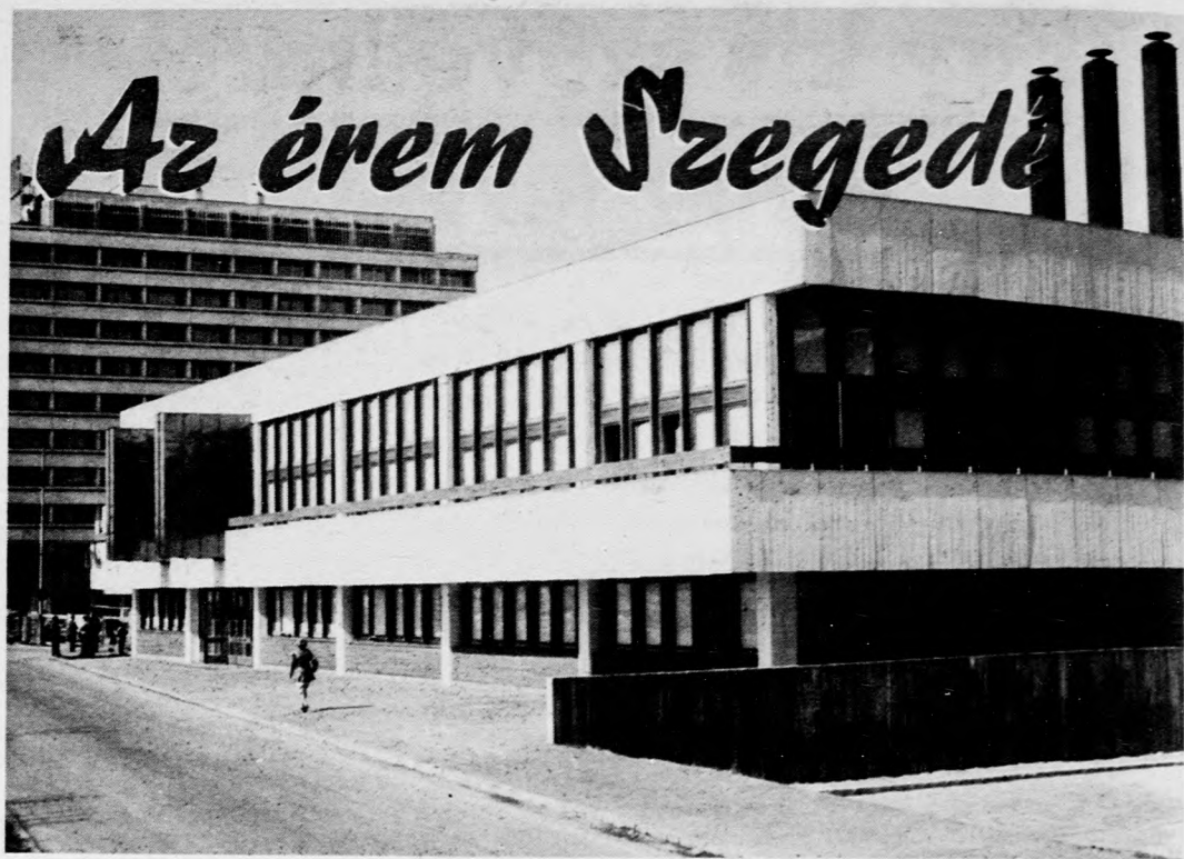
Az Urbanisztikai Társaság Szegeden rendezte IV. országos városépítési tanácskozását. Harminc éve november nyolcadikát jelölik világszerte a városfejlesztés szakemberei a közös gondolkodás, a tapasztalatcsere időpontjával.