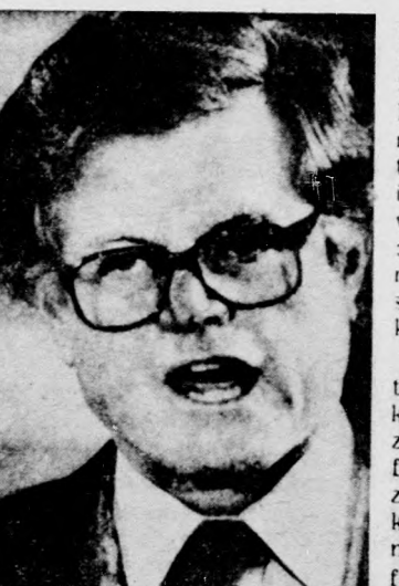
Edward Kennedy szenátor bejelentette, hogy pályázza a Demokrata Párt elnökjelöltségét az 1980-as választásokon

Edward Kennedy szenátor szerdán hivatalosan is beje-