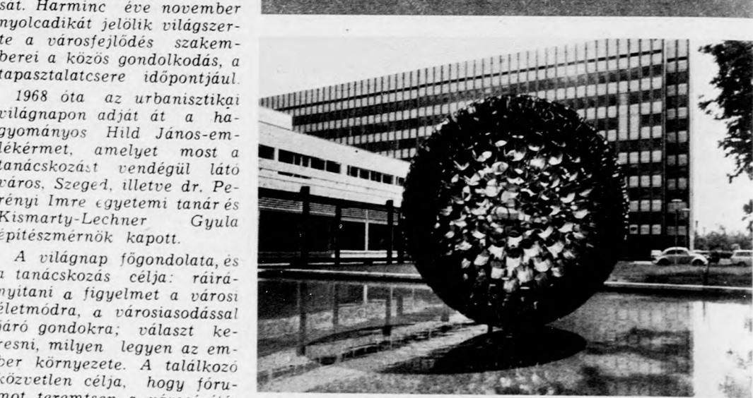
Szegeden, a kerületi szinten látványos díszes a környezeti díszítés felújítását.