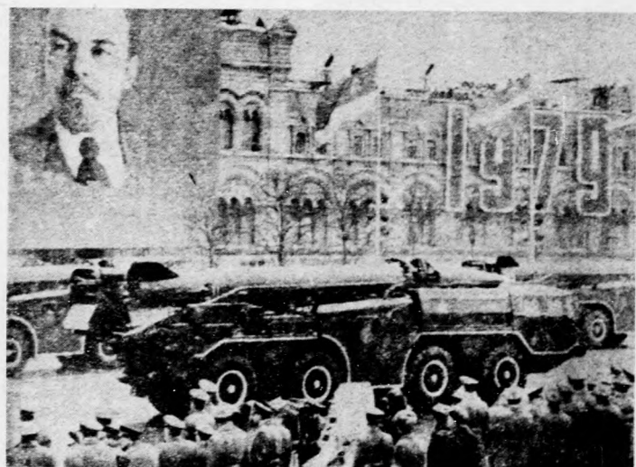
Moszkvában katonai díszszemlével és a dolgozók felvonulásával emlékeztek meg a Nagy Októberi Szocialista Forradalom 62. évfordulójáról. Képünkön: rakéták a Vörös téren

Impozáns katonai díszszemlével, színpompás felvonulással köszöntötte a szovjet főváros a Nagy Októberi Szocialista Forradalom 62. évfordulóját. A moszkvai helyőrség alakulatainak fejelemezett szemléjén Usztyinov marsall, honvédelmi miniszter mondott beszédet.