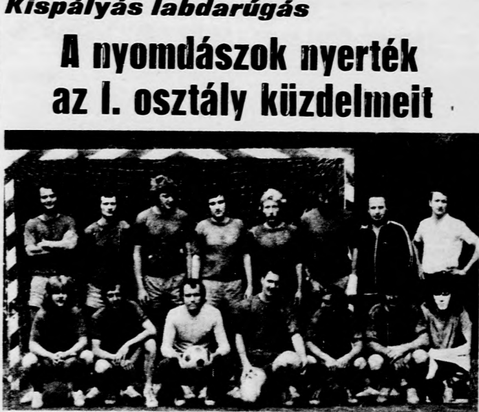
Az Altoldi Nyemda bajnok csapata

Tavasztól őszig sok hétvégen volt zúfolt ház a debreceni sporttelepeken — négy csoportban összesen 62 együttes küzdött a városi kispályás labdarúgó-bajnokságban. Az I. osztályban a D. Betű csapata bizonyult a legjobbnak, az Alföldi Nyemda gardája nyolc év után szerezte meg ismét a bajnoki címet. A II. osztályban a Posta, a III. csoportban a Volán KISZ, a IV-ben a Beloiannisz Híradástechnikai Gyár csapata diadalmaskodott. A csoportok végeredményei.