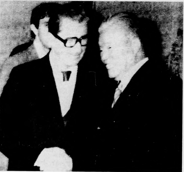
Lubomir Strougal csehszlovák miniszterelnök Tokióban két alkalommal tárgyalt Ohira Maszajosi japán kormányfővel. A képen a két politikus a második megbeszélés után búcsúzik egymástól. (Telefoto - AP - MTI - KS)

Németh Károly, az MSZMP Politikai Bizottságának tagja, a Központi Bizottság titkára csütörtökön a KB székházában fogadta a berlini pártbizottság delegációját, amely Konrad Naumannnak, a Német Szocialista Egységpart Politikai Bizottsága tagjának, a berlini pártbizottság első titkárnak vezetésével az MSZMP budapesti Bizottságának meghívására tartózkodik hazánkban. A szívélyes, elvtársi légkörű megbeszélésen részt vett Mehes Lajos, az MSZMP KB tagja, a budapesti pártbizottság első titkára. Jelen volt Rudolf Tosske, az NDK magyarországi nagykövete. (MTI)