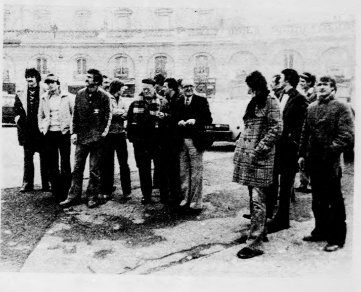
Városnézésen a debreceni kézilabdázók

Késő éjszaka volt már, mikor a város egyik éttermében megkezdődött a mérkőzést követő, a dijoni napokat lezáró bankett. A terített asztalok mellett a két csapat és vezetőikön kívül még jónéhányan helyet foglaltak, lehettek vagy száz az éjféli vacsoránál. S mintha valami központi elhatározás érvényesült volna a beszélgetésekkor - alig esett szó a Kupagyőztesek Európa Kupája mérkőzés hatvan percéről, viszont annál többször hallhattuk Debrecen nevét, a visszavágó időpontját. A két holland já-