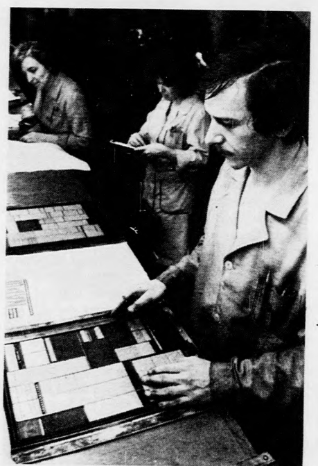
A tördelők kialakítják az oldal formáját

Hogyan készül a lap a nyomdában? Az úgynevezett linószedők szedik ólomba az úgynevezett hasábokat. (Sokszor kérdezik, mit jelent ez a szó. Gondoljanak a lap legfelső részétől egészen a legalsóig terjedő egyetlen csíkra: ez a hasáb, amit ha megfeszítünk — tehát csak a lap közepéig nézünk — akkor felekről beszélünk. (Egyébként ez 30 gépel sor egy oldalon.) Az újságkészítés utolsó, legfontosabb fázisánál tartunk, az időpont 2 óra 30 perc. Az Alföldi Nyomda Bajcsy-Zsilinszky Szocialista