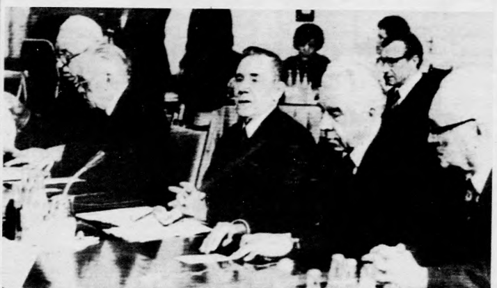
A szovjet tárgyalódelegációt Andrej Gromiko (középen) vezette

Erich Honecker, a Német Szocialista Egységpárt Központi Bizottságának főtitkára, a Német Demokratikus Köztársaság államtanácsának elnöke csütörtökön fogadta a Varsói Szerződés tagállamai külügyminiszteri bizottságát december 5-6-ri berlini ülésének résztvevőit, köztük Puja Frigyes magyar külügyminisztert. Az NDK-vezető a szocialista államok közössége összehangolt békepolitikájához való fontos hozzájárulásként értékelte a külügyminiszteri tanácskozás eredményeit. A szívélyes, baráti légkörű találkozon a tagállamok külügyminiszterei nevében Andrej Gromiko, a Szovjetunió Kommunista Pártja Politikai Bizottságának tagja, szovjet külügyminiszter mondott köszönetet a berlini tanácskozás eredményes lebonyolításáért.