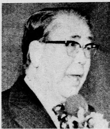
Csoi Kju Hát, Dél-Korea eddigi ügyvezető elnökét választották csütörtökön az októberben meggyilkolt Pak Csong Hi utódjává. Képünkön: az ország új államfője megválasztása után a sajtó képviselőinek nyilatkozik

A honvédelmi miniszteri bizottság ülésének magyar résztvevői Czinege Lajos hadseregparancsnok, honvédelmi miniszterrel az élen csütörtökön este hazakerkeztek. (MTI)