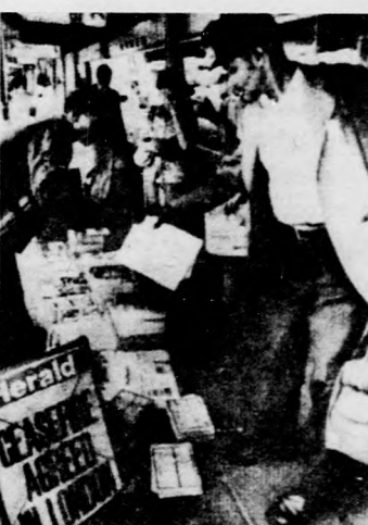
A londoni Zimbabwe-konferencián a létrehozandó tűzszünet feltételeiről tárgyalnak. Képünkön: élénk érdeklődés fogadta a salisburyi lapokat, amelyek az eddig létrejött megállapodásokat ismertették

LISSZABON. A Portugál Kommunista Párt KB Politikai Bizottsága csütörtökön közzétett nyilatkozatában határozottan elítéli a NATO nyugat-európai rakétatelepítési tervét. Az ilyen tervek gyakorlati megvalósítása az európai egyensúly felbomlásához, a fegyverkezési hajszához vezetne — állapítja meg a dokumentum.