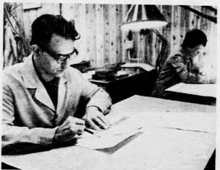
Munkában a korrekterok

— A szerkesztőségéből kihozott cikkeket elsőként én olvasom el — mondja meggyőzően, hogy nem figyelek oda az írók