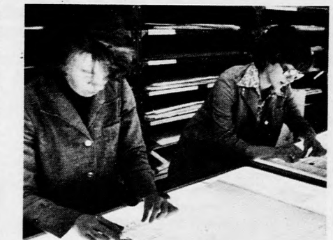
A munkafázis egyik része a montázás

mációk ezek, amelyeket a különböző hír-ügynökségek továbbítanak szerte a világba. A már említett ösftet eljárás az újságkészítés egyik igen bonyolult formája, erről részletesen most nem szólnok, mindössze csak annyit érdemes megemlíteni, hogy a korrekterok kezéből kikerült kefelenyomatok még több munkafázison mennek át, amíg a Napló felültheti végső formáját.