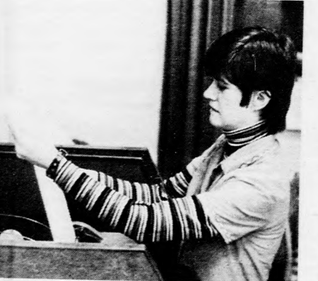
Friss információ érkezik a telexgépen

A nap folyamán fokozatosan beérkező újságcikkekkel válogatva a szerkesztő kialakítja a különböző újságoldalakat. Fontosabbak szövege, a végleges formát, az oldal küllemét a tördelőszerkesztő fantáziája dönti el.