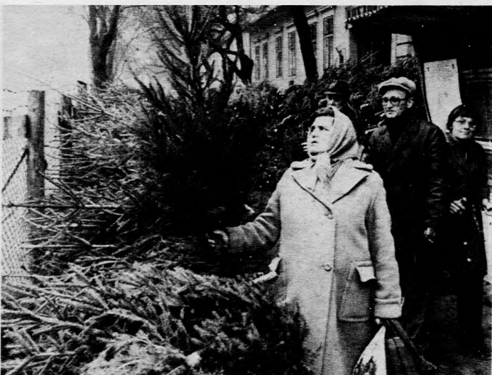
Ezen a héten Debrecenben is megkezdődött a karácsonyünnep

A tanácsnál dolgozó szakemberek a múlt héten, a vállalatoknál dolgozók pedig pénteken vettek részt a tanfolyam első előadásán.