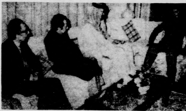
Szaddam Husszein, iraki elnök fogadja az arab országok jószolgálati küldöttségének tagjait, akik a béke érdekében akarnak közvetíteni. Képfőnök: Szaddam Husszein (jobbra), melléte Emir Szauud El Fejzal saudi külügyminiszter.

Közben a Közös Piacon más viták is folynak, például a költségvetésről, hogy tudniillik melyik tagállam mennyivel járuljon hozzá a közös költségek viseléséhez. Franciaország és Belgium után az NSZK sem hajlandó vállalni a rá kirótt összeget. Emlékeztet, hogy Nagy-Britannia már régóta küzd a maga részvételének csökkentéséért, sőt Londonban a munkárpárti politikusok egy része a Közös Piacból való kivevését szorgalmazza.