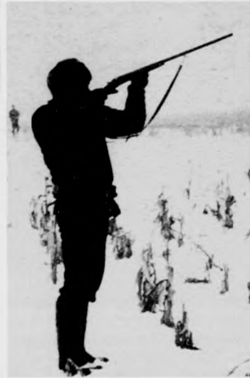
Nem kell sokáig várni a lövés után, a vadászat