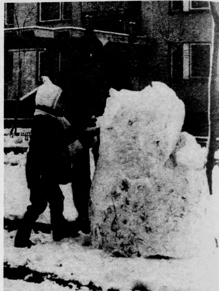
A hónap ezúttal is a gyerekek örültek a legjobban

Január 3-án az élelmiszer-üzletek délig tartottak nyitva, Debrecen jelentős ABC-áruházában, az újkertiben nem tartott ki egész délelőtt a friss kenyér, kénytelenek