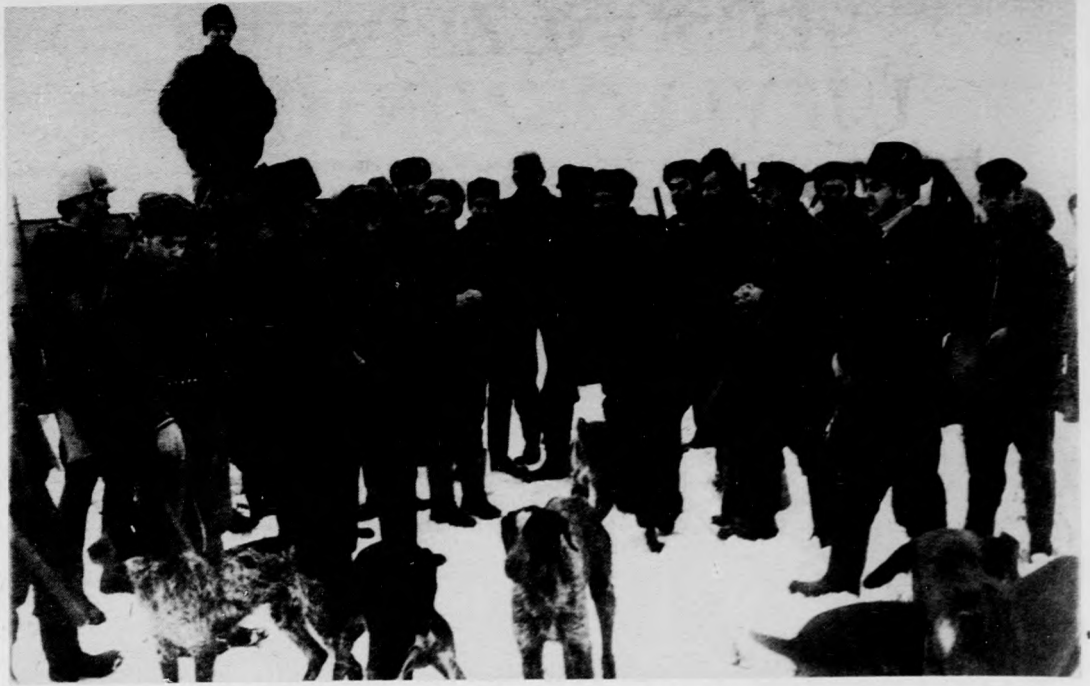
A megadott időben és helyen a vadászat minden kellékével várják már a társaság tagjai, hogy megkezdődjön a vadászat. Mielőtt elindulnának röviden megbeszélik a teendőket