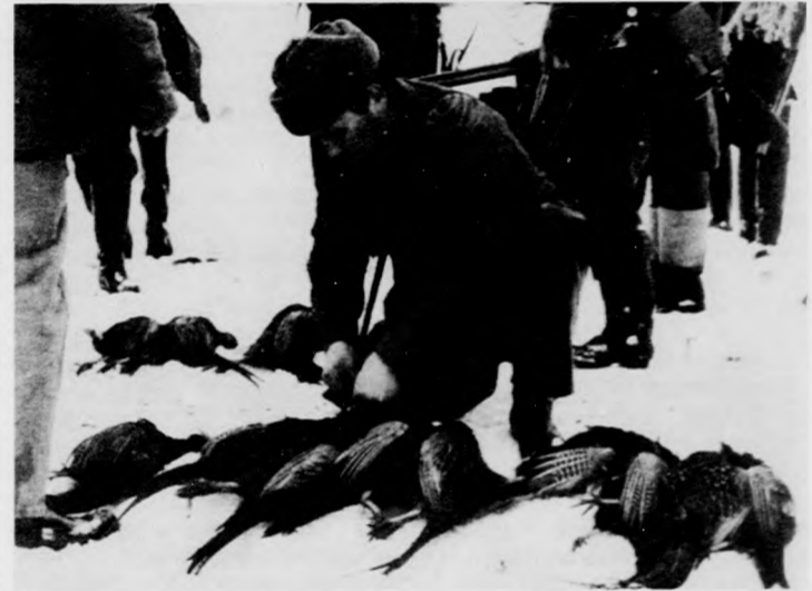
A vadászatnak vége, a lelőtt fácánok egymás mellett sorakoznak, párba kötik őket, hogy a „diszszemlén” jobban mutasson a terítés