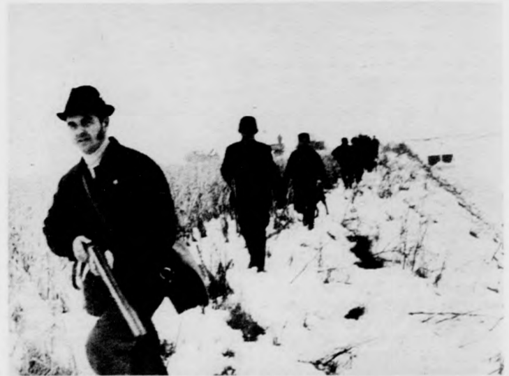
A vadászok csatárláncba fejlődnek

A tél fehér csillogása, a csikorgó hideg, a csizmák alatt ropogó hó különös hangulatot ad a vadászatnak télen. A nagyrábéi Petőfi Vadásztársaság egyik téli „munkanapjának” epizódjait mutatjuk be képriportunkban.