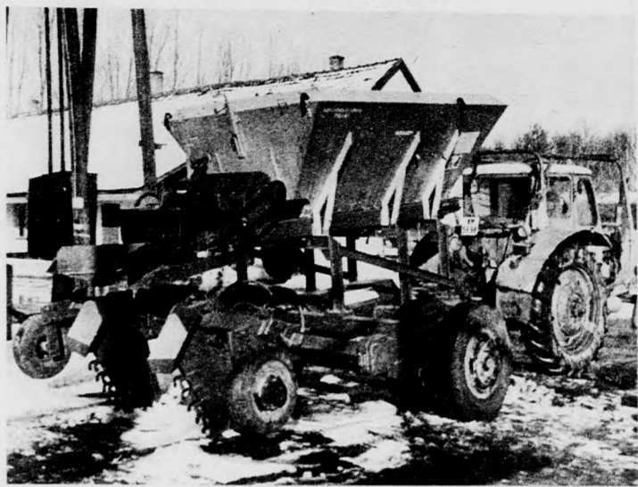
Karcagon tervezett mély javító gép

A karcagiak az V. ötéves tervidőszakban a K-9 „Talajtermékenység fokozása alapvetően új irányok kidolgozásával” című kormányzati kutatási célprogram keretében végezték tevékenységüket, bázisintézet megbízottként. 1976-ban az intézetet a Debreceni Agrártudományi Egyetem szervezték a kapcsolatok az egyetemi kutatások továbbfejlesztése és az oktatás korszerűsítése érdekében. Ezzel közel egy időben megbízták a meliorációs tevékenységre, a talajművelésre és a talajjavítás fejlesztésére irányuló kutatások koordinálásával. Az 1977-79-es időszakban az intézet öt szolgálati szabadságát fogadták el, melyek szorosan kapcsolódnak a gyakorlati élethez. Ezek közül kiemelkedő a juhok iparszerű legelők tartására készült eljárás és elrendezés terve. Ez a szabadság a juhok zárt legelőegységein történő tartásának szakaszos legeltetési, valamint korszerű ivóvíz-ellátási módszerét, technológiáját tartalmazza. Az intézet kutatási munkájából nyolc jelentős eredményt terjesztettek fel 1979-ben a MEM Kutatási és Szakoktatási Főosztályához. Az egyik a Közép-Tisza-vidék talajainak javításával,