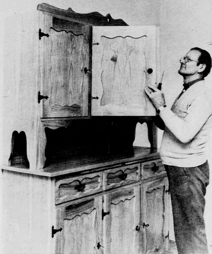
Készül a szekrény

— Évekre előre. Csak egy példát. Ahhoz, hogy jó munkát végezhesen az ember, jó faanyag kell. Csak a faanyag megfelelő szállítására két évet kell fordítani.