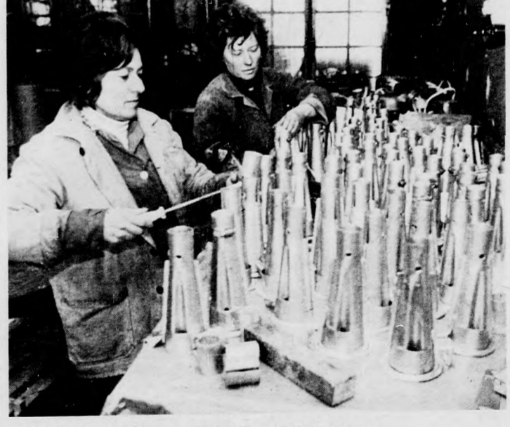
A kipufogódobra erősíthető a torlószelep

A jelenlegi elképzelések alapján idén körülbelül hetven különböző típusú munkakamrát készítenek megrendelésre.