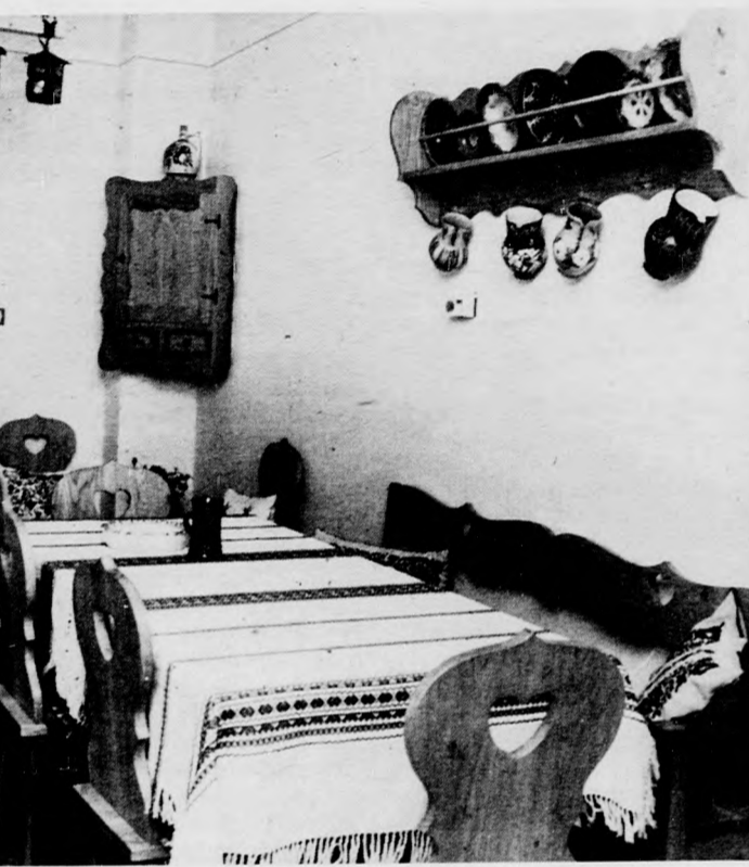
Egy ebédlőgarnitúra