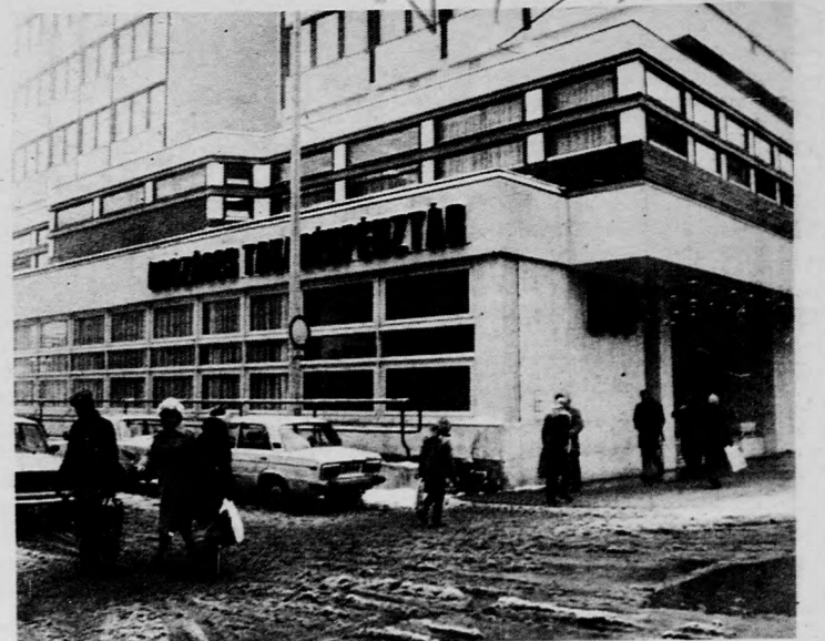
Az OTP új debreceni székháza