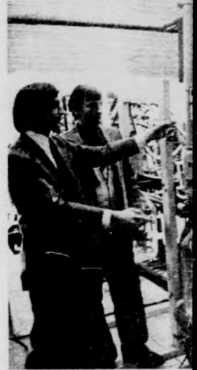
NDK gyártmányú dezes ágankénti tejmas berendezés

A mezővári gépészemberképzés 1978-ban pelté 25 éves jubileum mezőgazdasági szakemberek képzésében 1949-ben kezdődött meg a Békésgyógyi városban, amikor nálóval beindult az ország első mezőgazdasági középiskola. Az 53-as tanévben kezdett te a mezőgazdasági technikusok képzése. A mezőgazdasági gépésziskola kar — a Debreceni Agrártudományi Egység szervezeten belül — ben jött létre az addig s főfokú technikum átszervezésével. A kar nappali zátán három-, levelezési zátán négyéves képzési folyik a gépész üzemr