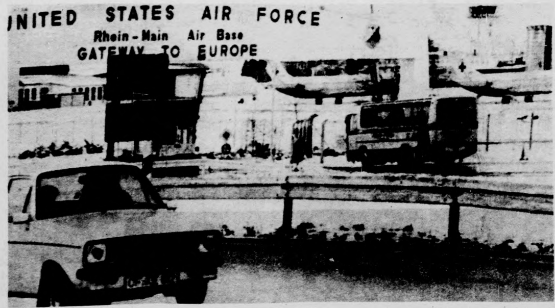
Az NSZK-beli Frankfurtban levő amerikai katonai repülőtéren ismét készenlétbe helyezték a vöröskeresztes gépeket, arra az esetre, ha az Iránban fogva tartott túsok hamarosan kiszabadulnának

Laitin végül hangoztatta, a most bejelentett két intézkedés „megkönyvitja a dollár és arany Iránnak történő áttulását”, de figyelmeztette arra, hogy „minderre csak a megállapodás létrejötte és a túsok szabadonbocsátása után kerülhet sor”. Ezzel egyidejűleg az algériai fővárosban több órán át tárgyalott egymással a befagyasztott iráni betétek átutalásának kérdéséről több angol, amerikai és algériai pénzügyi szakértő. Az ABC amerikai televíziós hálózat péntek délutáni értesülése szerint „létrejött a teljes megállapodás a túsok szabadonbocsátásáról és most már csak a hivatalos szöveg megfogalmazása van hátra”.