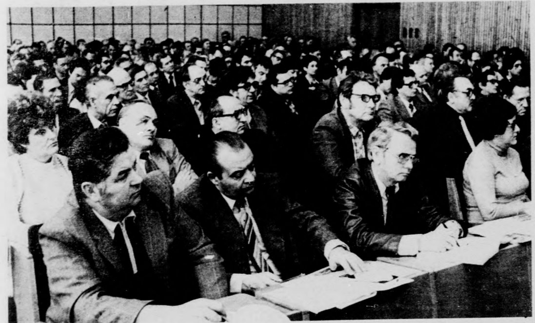
Az országos tanácskozás résztvevői

A tegnapi plenáris ülésen elhangzott főreferátumok után az országos propagandanácskozás ma az egy-egy előadás témaköréhez kapcsolódó szekcióülésekkel folytatódik.