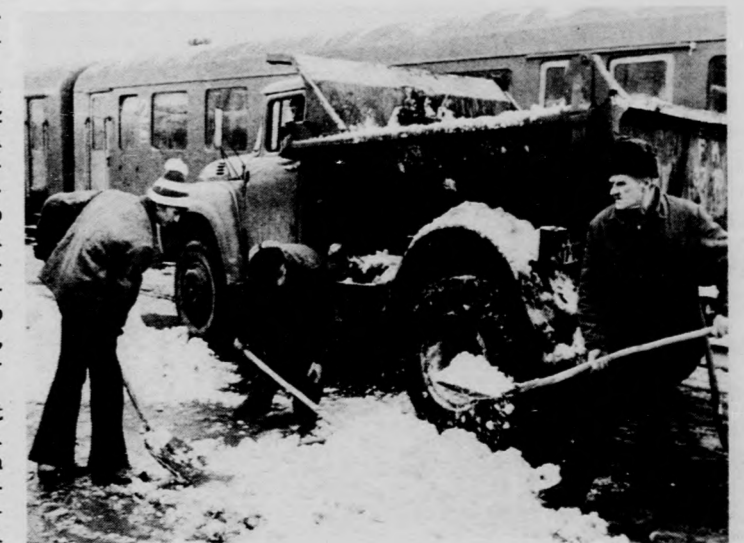
A debreceni Nagypályán peronjairól teherautókkal szállítják el a havat

A MÁV Debreceni Igazgatóság területén nem okozott problémát a havazás. A váltókat folyamatosan takarítják, a vonatok kisebb késéssel közlekednek.