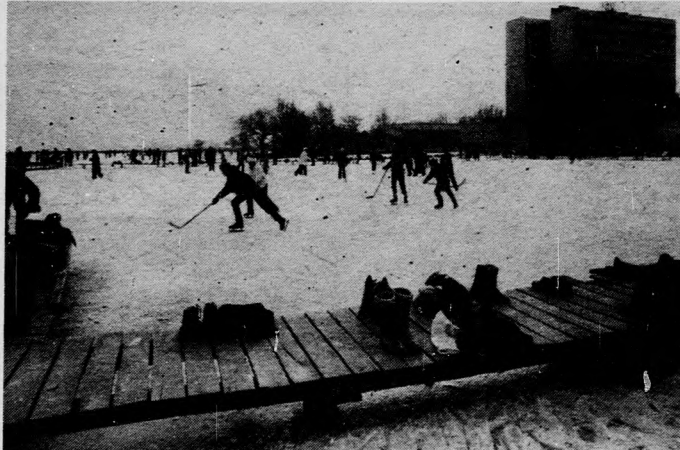
Sok százan keresik fel az ország legnagyobb „korcsolyapályáját”, a Balatont. A képen: telt ház a keszthelyi öbölben.