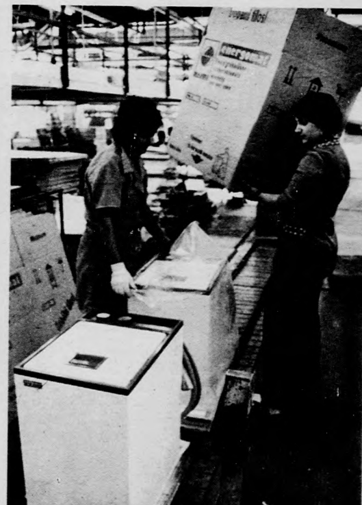
Szállítás előtt az Energomat