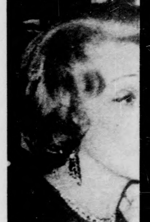
Marlene Dietrich és...