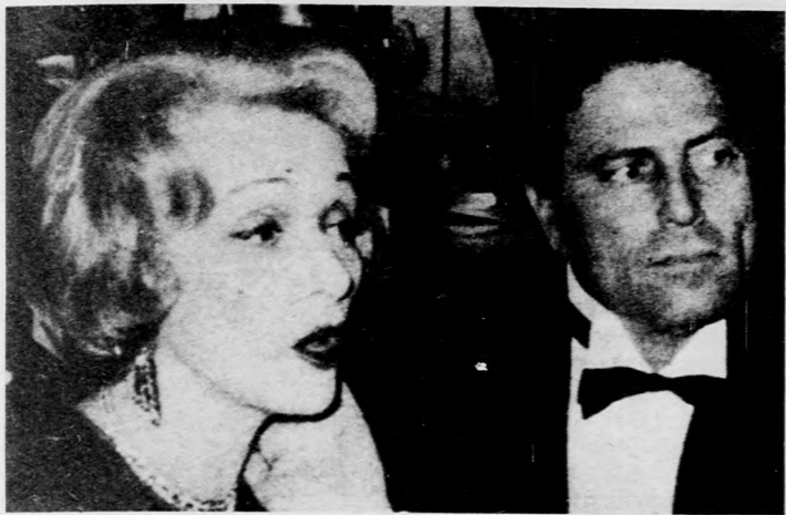
Marlene Dietrich és Raf Vallone

Marlene igazán szívtelenül kezelte a parókáit, elhajította valahová, ha hazatért, aztán mindenfelé kereste. „Néha az ágy alatt vagy bútorok mögött találtam meg a parókáit!”