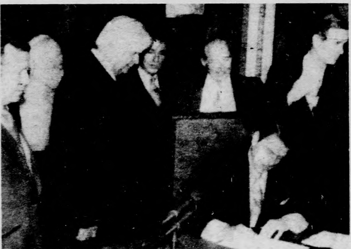
Első hivatalos ténykedéseként Reagan elnök aláírta a kormányának névsorát tartalmazó listát

A szerda reggeli szovjet lapok a TASZSZ washingtoni tudósítása alapján adnak tényyszerű jelentést az új amerikai elnök, Ronald Reagan hivatalba lépéséről, az új elnök beiktatási beszédéről. A jelentés a többi között megállapítja: Kormányának külpolitikai programjáról Reagan mindössze azt mondotta, hogy az amerikai nép a békét legrágóbb kincseknek tartja, de ugyanakkor azt bizonyította, hogy a béke biztosításának legjobb útja, „erőnk megnövelése” az egész világban.