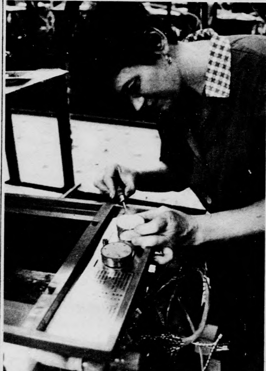
Szerelik az elektronikát

Az export és a termelés növelésén kívül figyelemre méltó, hogy gazdaságosabban termelt 1980-ban a Hajdúsági Iparművek. Számos mű- szaki és gazdasági intézke- dés révén az export jövedel- mezősége közel 7 százalékkal növekedett. A hazai szállítá- sok ütemének tartásával a belföldi piaci munka is egyenletesebb lett. A jó mun- kát végzett kollektívának, a hatékonyabb vezetésnek kö- szönhetően a Hajdúsági Ipar- művek 1980-ban számottevő nyereséget ért el.