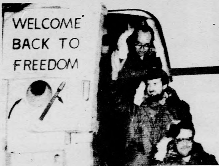
A Teheránból szabadon bocsátott amerikai foglyok szerda hajnalban érkeztek meg az Egyesült Államok egyik NSZK-beli légitámaszpontjára. Képünkön: a túszok kiszállnak a repülőgépből

Carter volt amerikai elnök szerdán az Egyesült Államokból elindult Wiesbadenbe, hogy rövid időt együtt tölthessen a kiszabadult túszokkal. Reagan elnök személyesen megbízottjaként küldte Cartert Wiesbadenbe. Ez a gesztus annak szól, hogy a túszok kiszabadulása azoknak a tárgyalásoknak az eredménye, amelyeket Carter megbízottai folytattak Iránnal. Reagan Carter rendelkezésé-