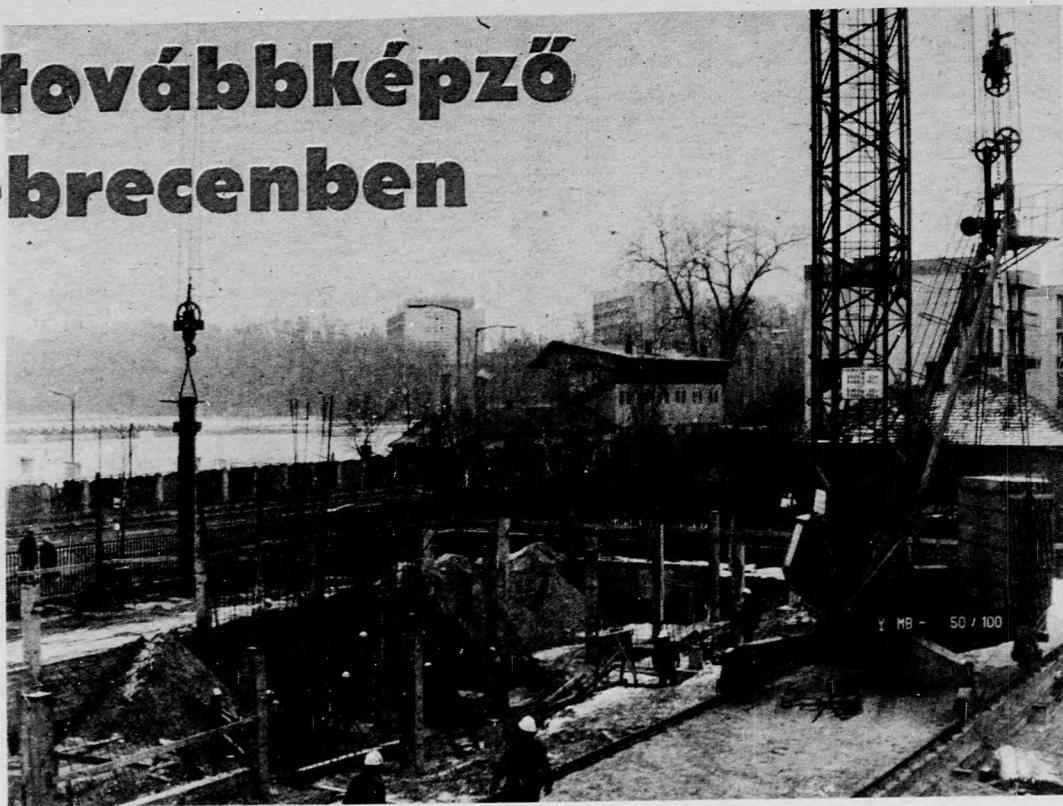
Munkában a kubikosok

ÉPÜL A KÖZPONTI GYÓGYSZERTÁRI LABORATÓRIUM