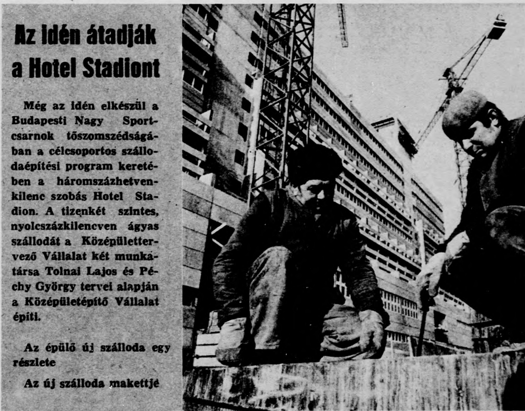
Az idén átadják a Hotel Stadlont