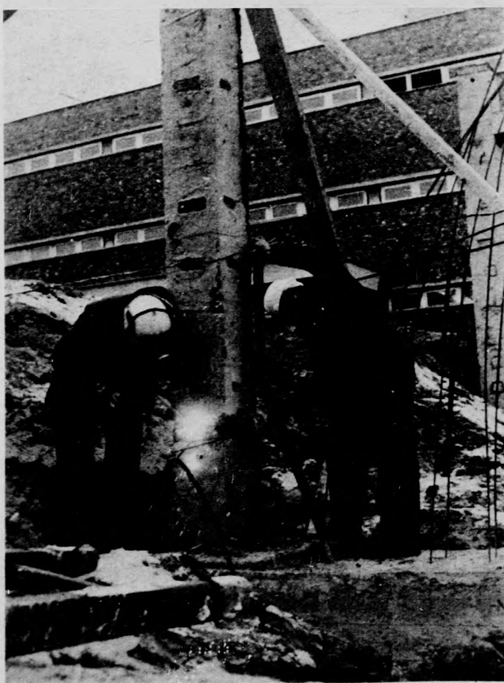
Hegesztik a fűdémpaneltartó betonoszlopot