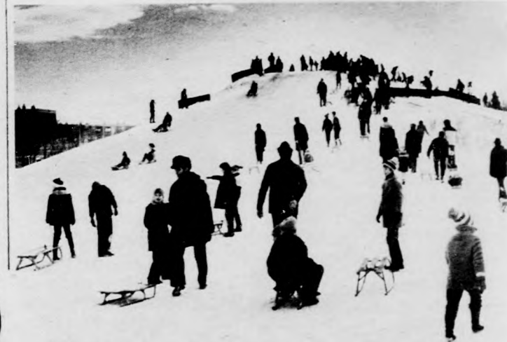
Újkerti örömök

Egyik nagyvállalatunk, a Tisza menti Vegyiművek gazdasági igazgatóhelyettesével készített interjú közlő a Szolnok megyei Néplap január 23-i száma. Egyik legnagyobb vegyipari üzemünket rendszeresen sújtja az anyagihiány. Hol a kén, hol a nyers foszfát hiányzik, s tavaly már szódára, vagy foszforra is várniuk kellett. A hátrány egyúttal előny is jár. Kihasználva a kényszerű munkaszünetet, folyamatosan elkezdtek növelni a mosószergyártást, s az új megrendelőkkel való kereskedelmi szerződések révén másfél-szeresére sikerült növelniük a nyereséges termékek gyártását.