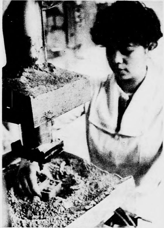
Egletesre téglateknőbe helyezik a biztosítókat