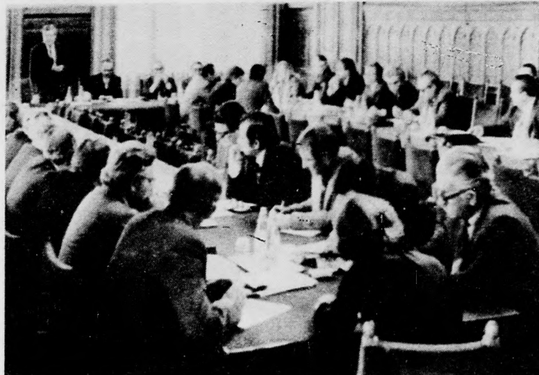
Pozsgay Imre művelődési miniszter tartja tájékoztatóját

A minisztériumok és a tanácsok együttműködésének tapasztalatairól cseréltek véleményt három tárca, illetve a fővárosi tanács és a megyei, megyei városi tanácsok vezetői pénteken a Parlamentben tartott tanácselnöki értekezleten.