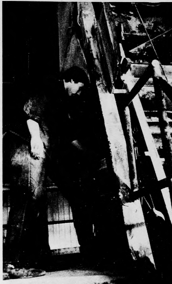
Nagy figyelem kell a massa pontos keveréséhez