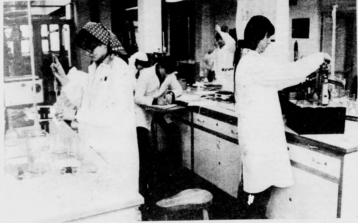
A vegyészeknél megoldhatatlan a vállalati gyakorlati oktatás. A debreceni vegyipari szakközépiskola tanulói az iskolai laborban sajátítják el a fogásokat

Ime egy szempont. Van persze több is, de az elmondottakból érezhető — egy-