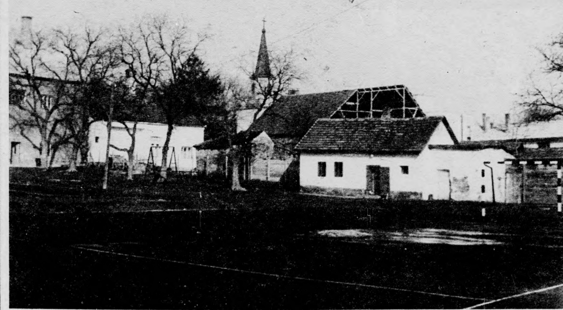
A pálya már a diákokat várja. Az iskolában most újabb ötleteken török a fejüket: labdafogó háló, parkosítás szerepel az idei tervek között, s az iskolaépület felújítása idején a pálya menti kis vízközlő szertár és öltöző készülő majd