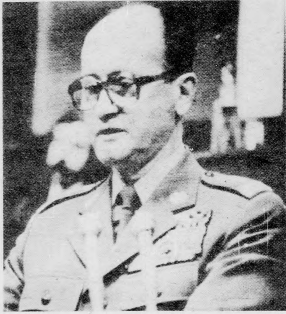
Wojciech Jaruzelski hadseregparancsnok a lengyel szjejm ülésén betervezi kormány programját

VARSÓ (MTI) — Wojciech Jaruzelski hadseregparancsnok, a Lengyel Népköztársaság új miniszterelnöke csütörtökön a parlamentben értékelte az ország jelenlegi helyzetét, és tömören összefoglalta az általa vezetett kormány alapvető szándékait.