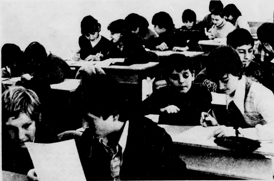
Gondban a versenyzők az úttörő korosztály elméleti versenyén