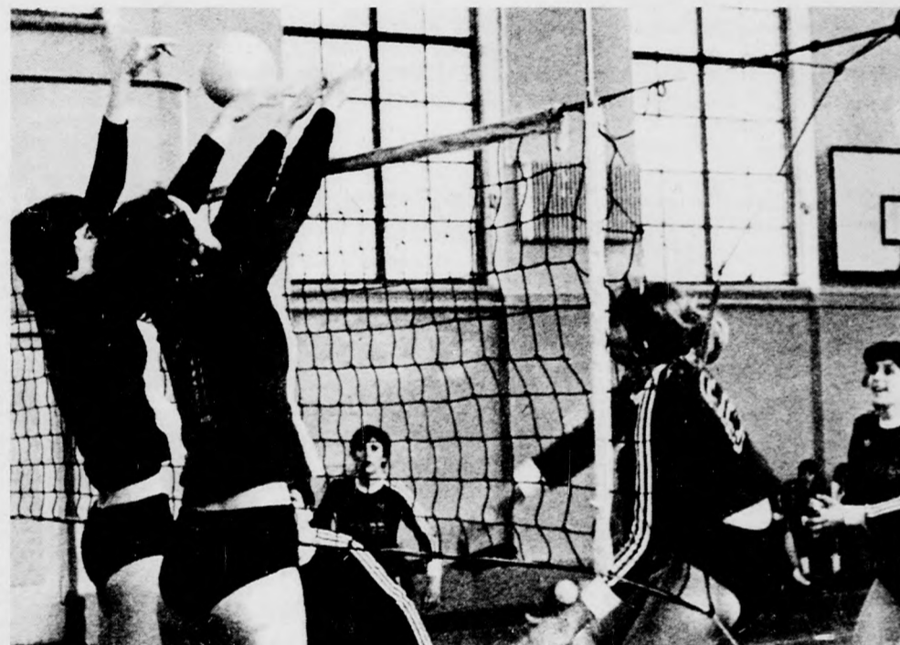
A debreceni sánc (Marek és Tóth) hátrítani igyekszik Gallainé (6) leállítását

A felnőtt NB I-es csapatokkal párhuzamosan az egyesületek junior együttese is mérkőzött. Újpesti Dózsa—DMVSC 3:2 (—, —, 8, 17, 6, 12). Debrecen. A fővárosiak jobban bírták a hajrárt a jól kezdő debreceniekkel szemben. — Újpesti Dózsa—DMVSC 3:1 (—12, 14, 5, 11). Budapest. A tapasztaltabb újpestiek a debreceniek korai elfáradása folytán megérdemelten nyertek.