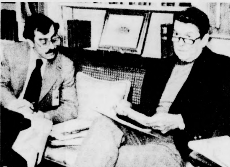
Ronald Reagan és beszédírója a Fehér Ház könyvtárában, a kongresszus és a nemzet elé terjesztendő gazdasági expozé dolgozik