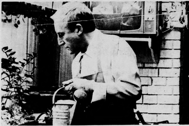
ISTEN HOZTA, MR. ... Szociális amerikai film - Rendezte: HAL ASHBY Fotószereplő: Peter Sellers és Shirley Maizland

tozik. Ilyen például a tisztított csomagolt burgonya, melynek ára legutóbb 8 forintról 10 forintra emelkedett. Különböző savanyúságok, befőttek, konzervek ára csak kismértékben változott, így ezek nem okoztak nagy növekedést vagy csökkenést az ételárakban. Átlagosan 40–50 fillérrel változtak az árak, maximum egy forinttal. Az olyan ételek ára természetesen csökkent, amelyekben csökkentett árú alapanyag is található.