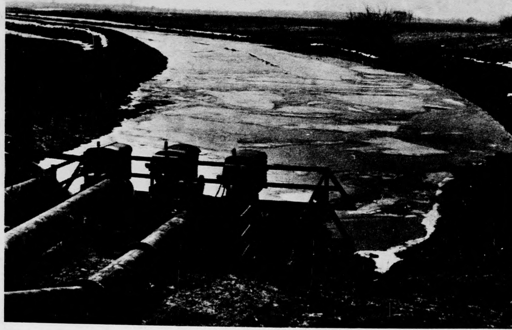
Szivattyúállás a Kis-Körösön

MUNKÁBAN A SZIVATTYÚTELEPEK — CSÖKKEN A BELVÍZ