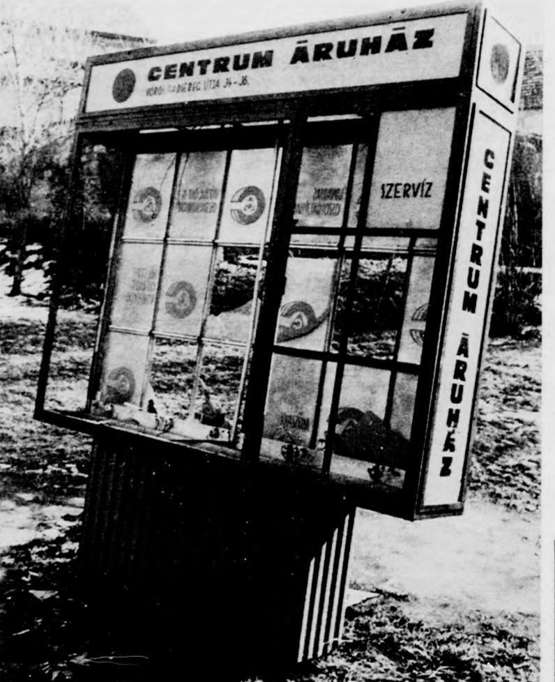
A mellékelt képen látható kirakat Debrecenben az Árpád teret díszíti.

igyekszünk minél többet len-csevégre kapni közülük, s mert több szem többet lát, ol-vasóinkat is kérjük, ne sajnálják a fáradságot, ha valami „szurja a szemüket”, jelez-zék — szóban, írásban vagy telefonon — a Napló belpolitikai rovatának. Környezetünk szépsége, rendezettsége mindannyiunk ügye, örökjünk hát közösen fölöt-te.