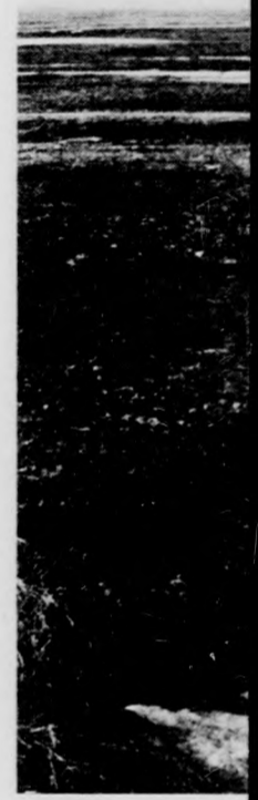
A belvizek levágnak

Napjainkban megyei vízügyi mezőgazdasági ümoló értekezletéjünk szót a 19 kívül széles időjárásról, ebből származó és káráról. Ha önmagában természetesen nem lehet panasz rendkívül nehéz között a gondos ményes volt. De lehetett volna a ha a belvicsapnak? A jelenlegi tavaszi helyze