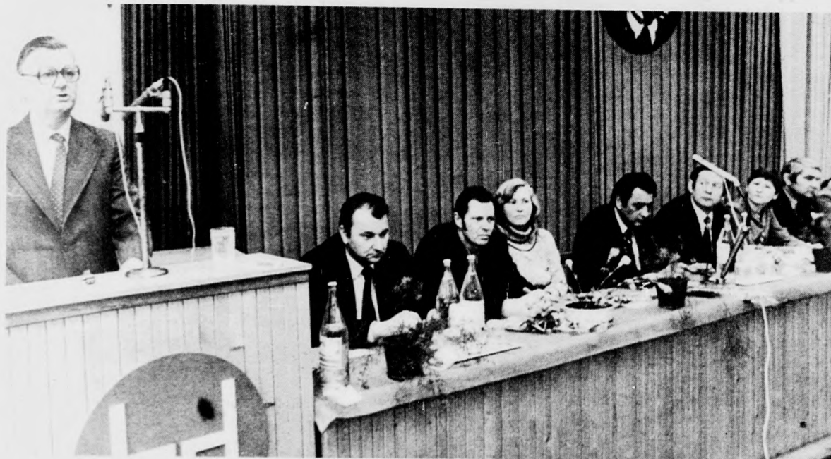
A barátsági nagygyűlés elnöksége

Szovjet-magyar barátsági nagygyűlés a Szék- és Kárpitosipari Vállalatnál