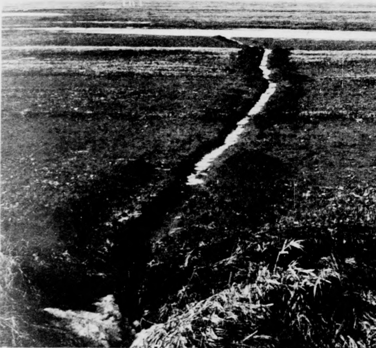
A belvizek levezetésében az ideiglenes árkok is sokat segítenek