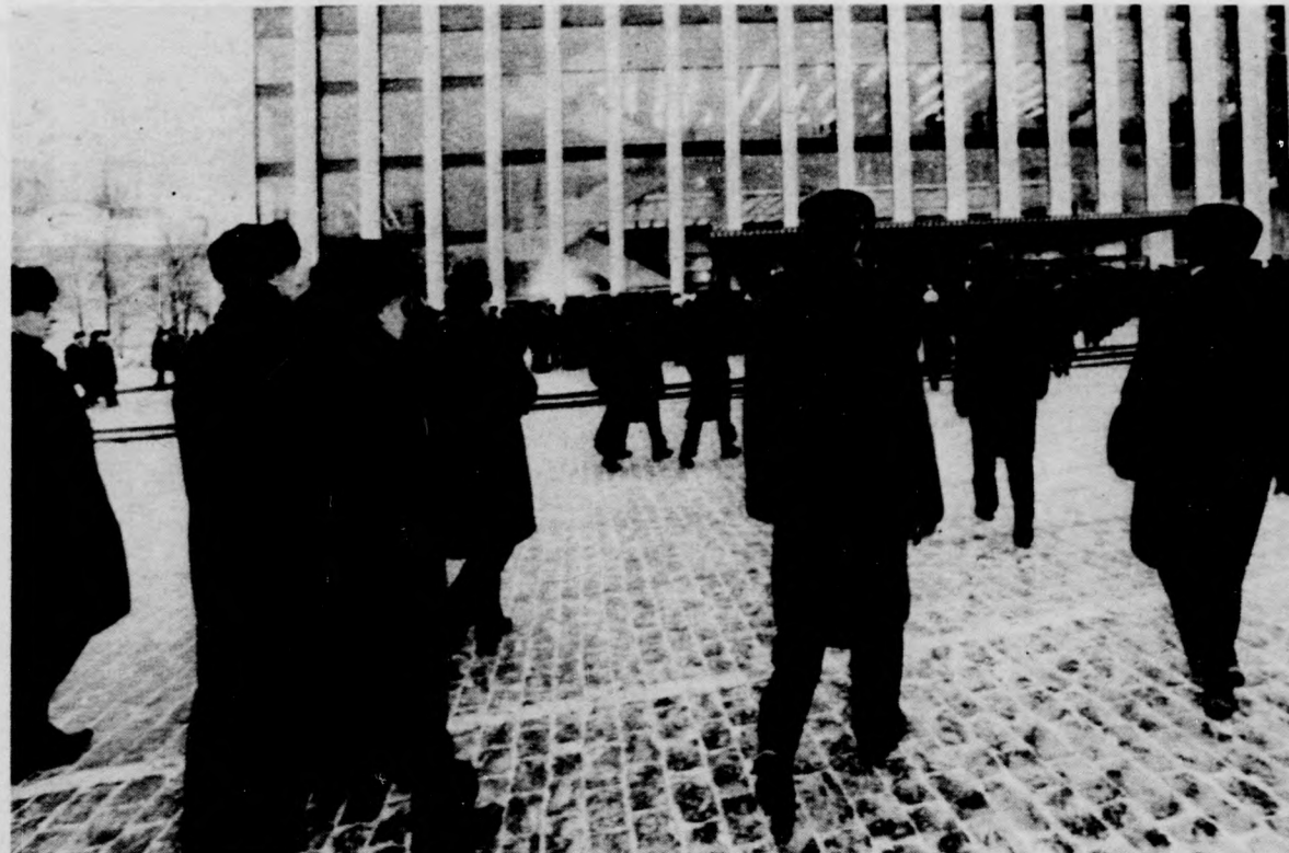
Az SZKP kongresszusának színhelyére tartanak a küldöttek