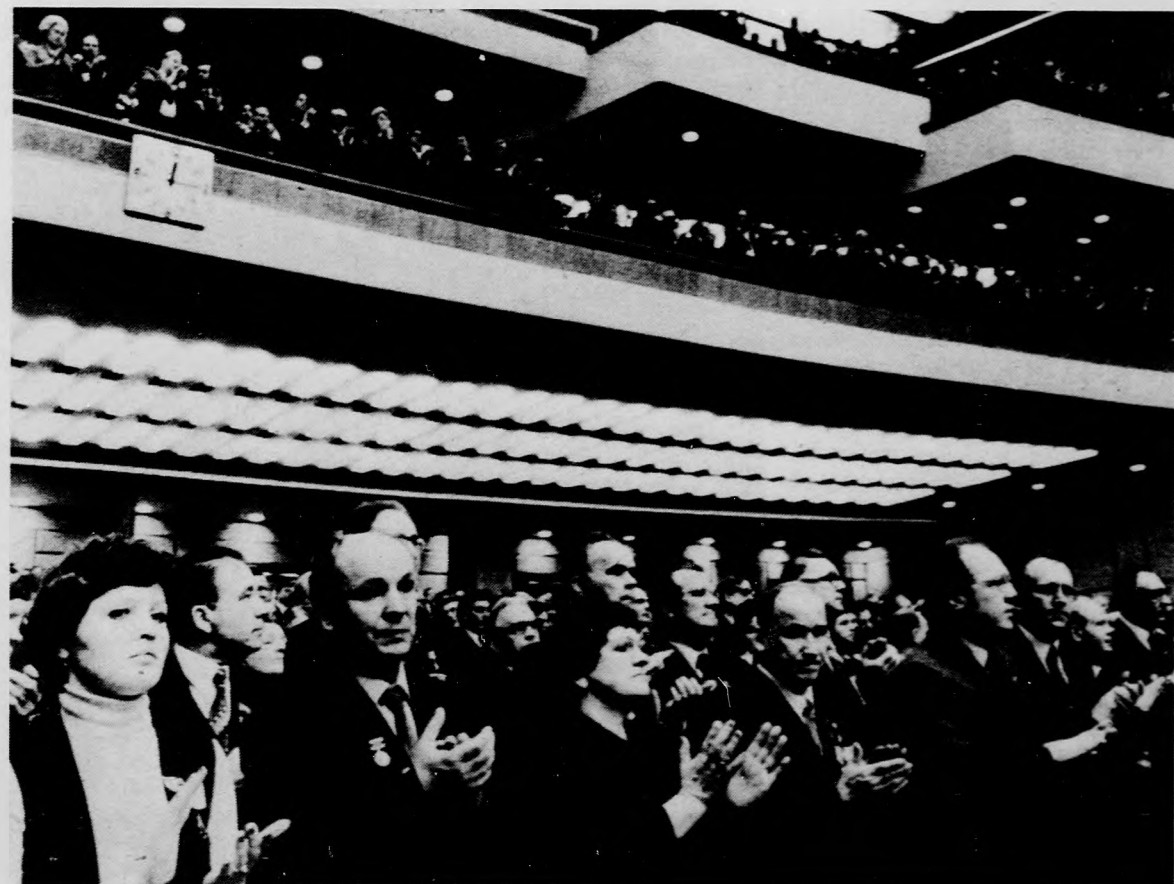
Az SZKP XXVI. kongresszusán.