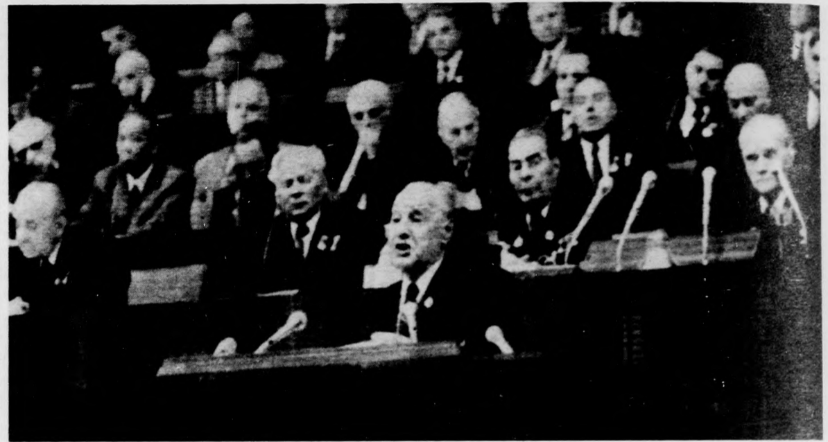
Kádár János üdvözlő a SZKP XXVI. kongresszusának résztvevőit. (Telefotó — TASZSZ — MTI — KS)