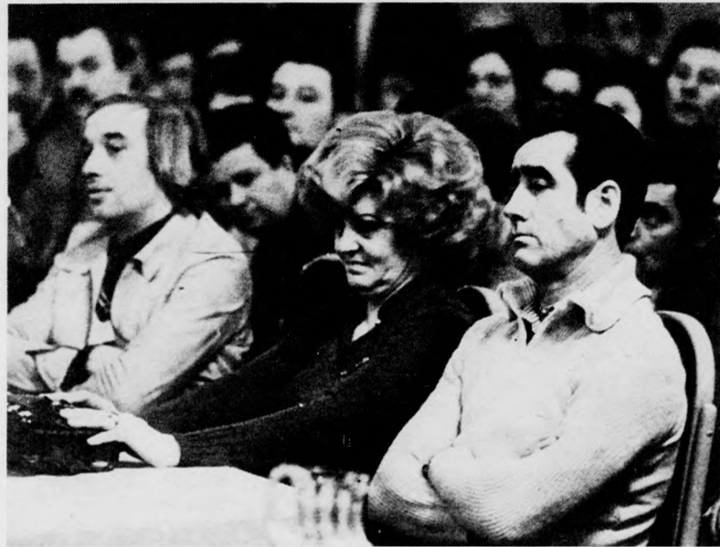
A licit nagy pillanatai.

— A Díofát például hozva, személyzete húszról tizenkettőre csökken, de kevesebb lesz (vállalat részéről) az adminisztráció, az ügyvitel.