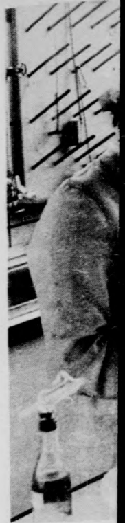
Györgyi J. dokok és t.