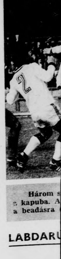
Három... kapuba... a beadásra