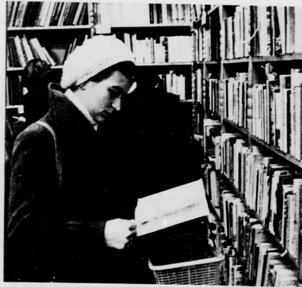
A régebbi meséskönyvekben is vannak jó me- sék a gyerekeknek