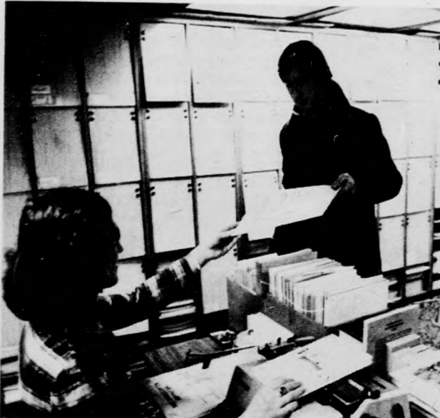
Ebben a könyvesboltban kapható zenemű is