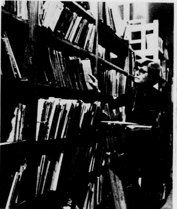
A pinceraktárakban még sok kiadvány várakozik