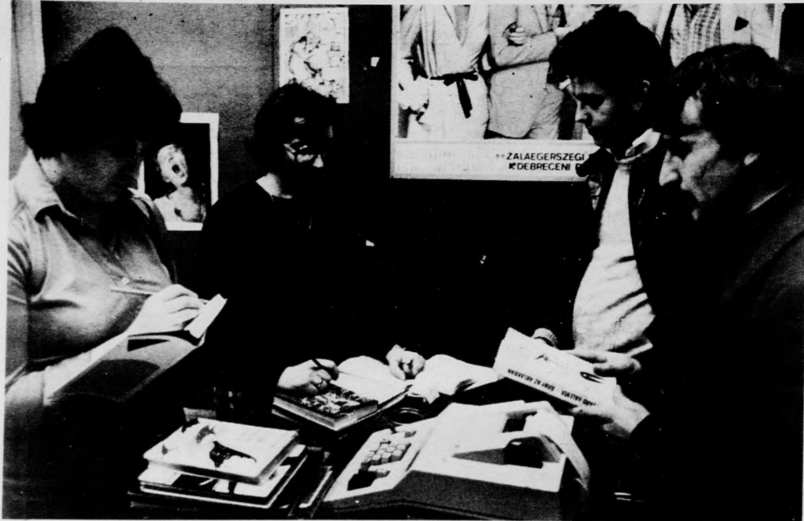
Az árazás nagy szakértelmet kívánó munka: pontosan kell ismerni minden könyv értékét