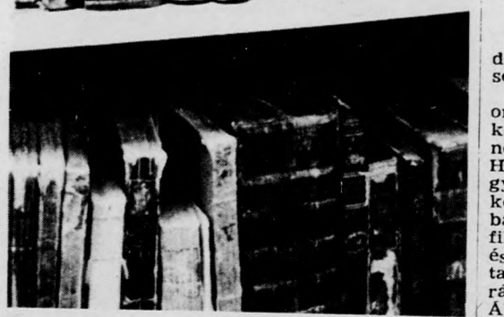
Könyvtörténelem: a kötetek kiadási évszáma 1700 és 1800 között van