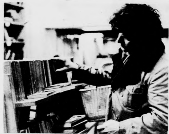
Valami jó olvasnivaló kellene, ami nem drága...