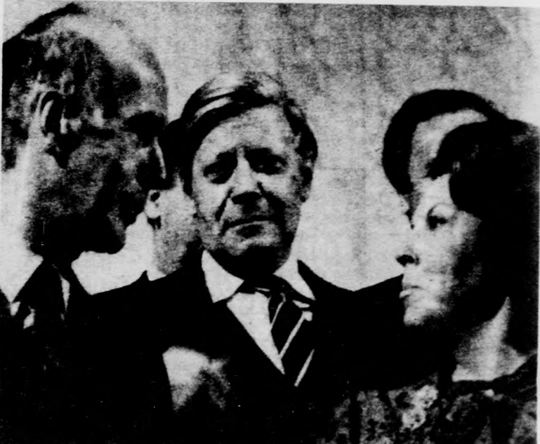
A hollandiai Maastrichtban megkezdődött az Európai Gazdasági Közösség csúcsértekezlete. Képünkön: Giscard d'Estaing francia elnök, Helmut Schmidt nyugatnémet alkancellár (középen) és Beatrix holland királynő a közös piaci vezetők csoportjában