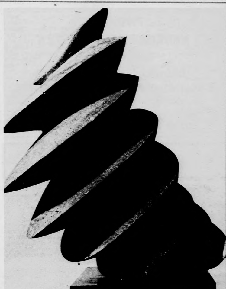
SIKLÓSI SZÜRKE II.

Örülhetünk ennek a (minden művész pályáján) merész lépésnek: látva itt az Egye-