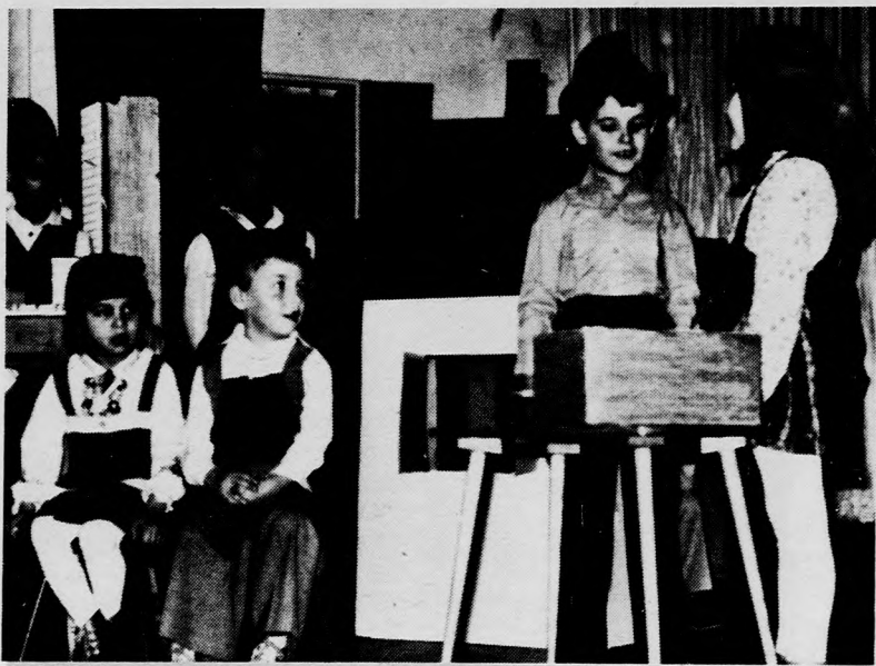
Nyírmártonfalvi óvodások