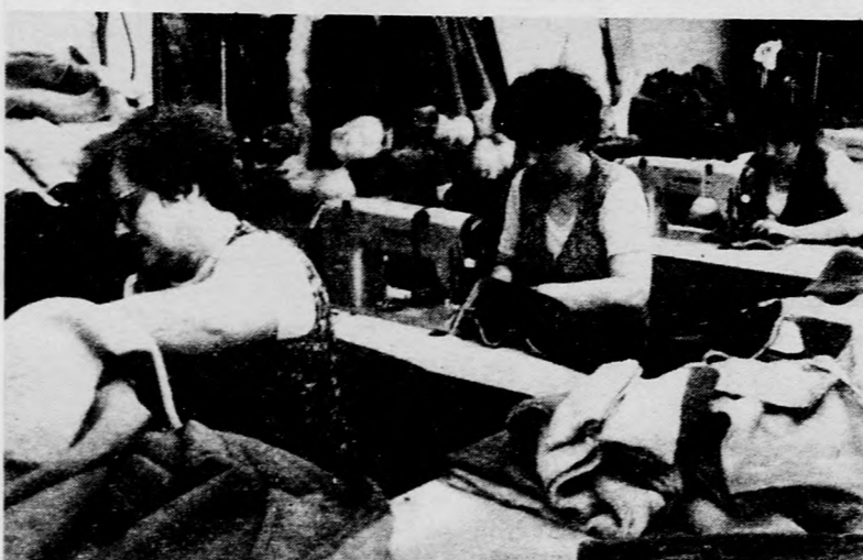
Naponta 45—50 irhabundát készítenek a „szőrme- szalag” Tyereskova brigádjának asszonyai, lányai