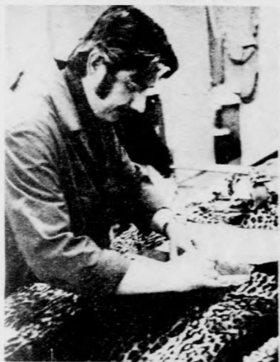
Az idén akadozik a szőrmeállítás, nem tudják lekötni a szabászat kapacitását

A debreceni üzemegység- hez néhány szolgáltató rész- leg is tartozik: a városban öt helyen működik szabó- ság — közülük egy szőrme- szalon, egy pedig kalapok, egyenruhák készítésével fog- lalkozik —, s van a vállalat- nak Debrecenben két, saját termékeket árusító boltja is.