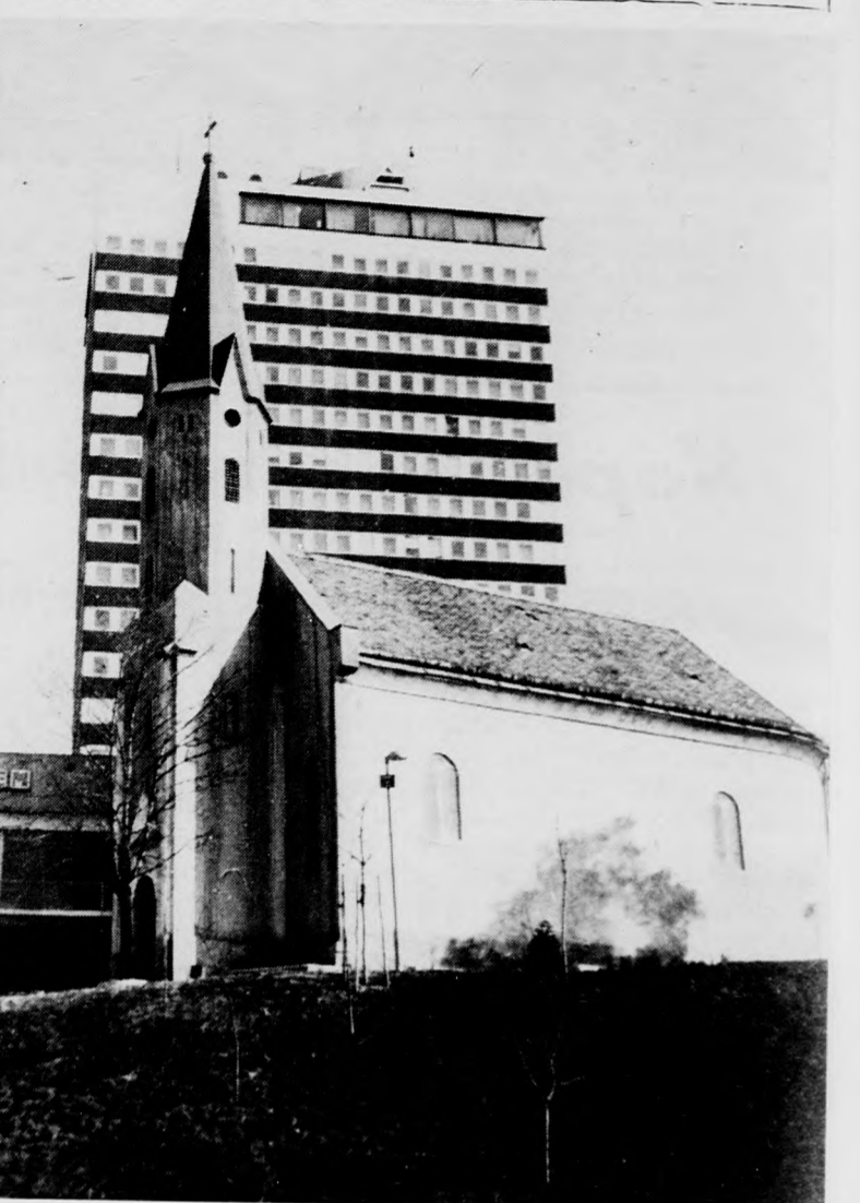
KÉT TORONY

A Hajdú-bihari Napló szerkesztősége fotópályázatot hirdetett olvasói részére. A fotókat folyamatosan október közepéig lehet beküldeni a szerkesztőségbe (Debrecen, Tóthfalusi tér 10.). A beérkező legjobb fotókat folyamatosan közöljük.