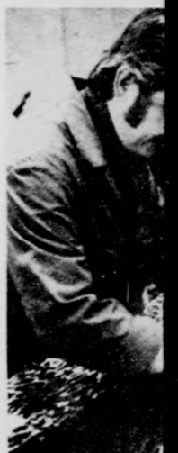
Az idén szőremlált ják lekötő kapacitása

A Hajdú-Textheldolgo hajdúszoboszlón részlegét kivonson és Debrecen egy-egy termelés ma ha kis külön megveszkelhet maradnak a és a nánási mögött, amely 55 millió „vállalt” 17 des azt jelzi, ben sem tétl