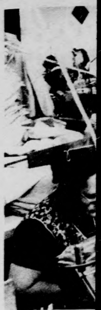
„Csom szernek, remben.

A tanfolyam résztvevői a hasznos tudnivalók megszerzése mellett alkalmat találnak arra is, hogy megismerkedjenek Debrecen nevezetességeivel.