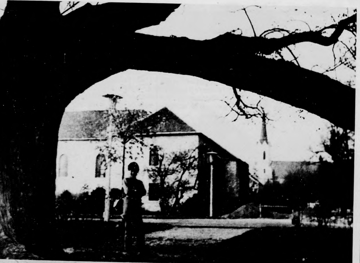
A fejedeleme fája Sárospatakon