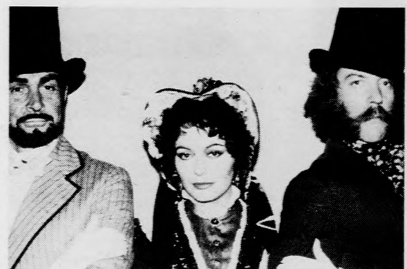
AZ ELSŐ NAGY VONATRABLÁS Színes, szinkronizált angol kölömbös - Rendezte: Michael Clayton Főszereplők: Sean Connery, Donald Sutherland, Lesley-Anne Down

A debreceni Művész moziban, a Központi Filmklub foglalkozásán március 28-án 17 órakor Gaál István Cserepek című magyar filmjét mutatják be, amit ankét követ. Ezt a filmet premier előtt vetíti a Híradó mozi is, március 30. és április 1. között.