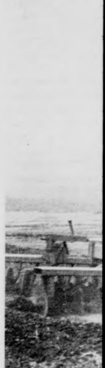
A hajdú almafák sorában

ELVESZETT a 26 400 sz. be-rettyóújfalui SZOLIVÁLL szem-lagarmitúra. Használat 1981. január 30-tól érvénytelen. (x)