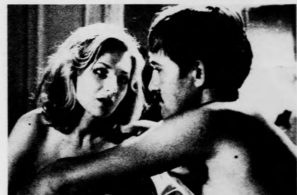
MENEDÉKHELY Színes lengyel film - Rendezte: ROMAN ZALUSKI