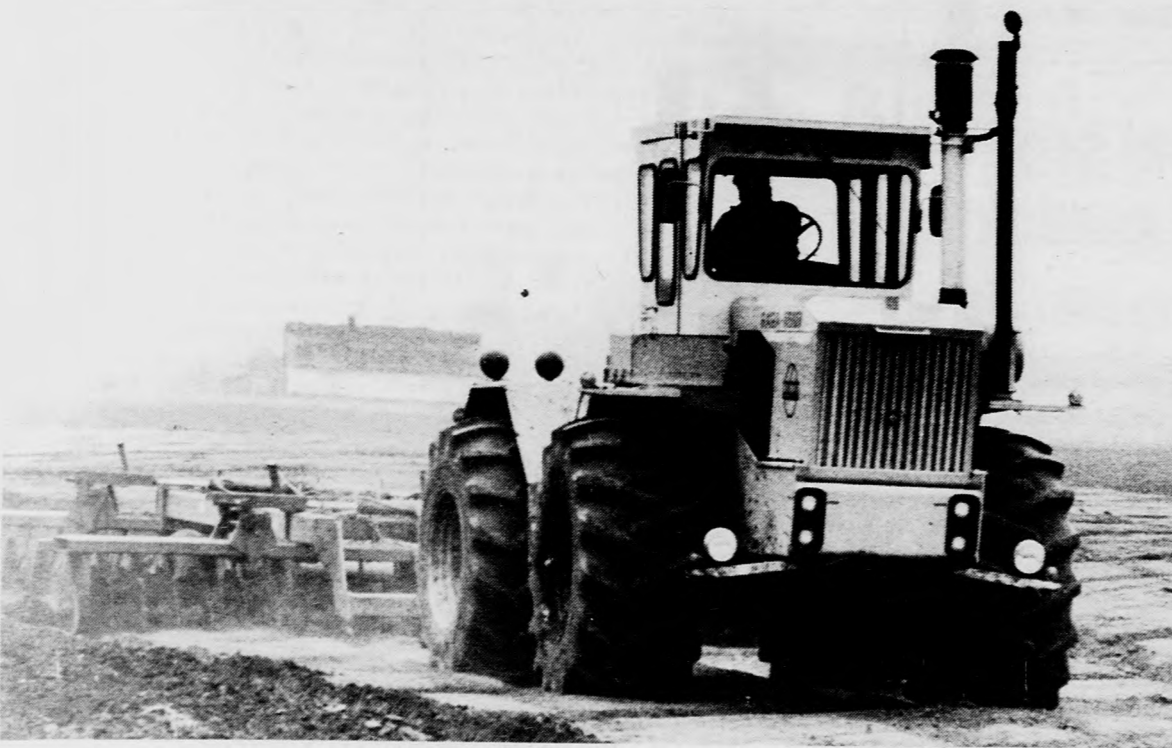
A hajdúhadházi Új Barázda Tsz-ben tárcsáznak, boronálnak, s kimérik az almafák sorát

A Kossuth laktanyában rendezett ifjúsági nagygyűlés a DIVSZ-induló hangjaival fejeződött be.