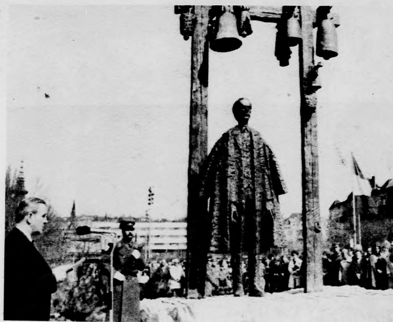
Bartók Béla születésének 100. évfordulója alkalmából Budapesten felavatták a zeneszerző emlékművét, amely Somogyi József szobrászművész alkotása

tartalékok s döntően a lehetőségek is a szervezésben rejlenek, amit különösen aktuálissá tesz a tervbe vett áttérés az ötnapos munkahétre. Nem kell pénz az utasok jobb kiszolgálásához, a pontosabb tájékoztatáshoz sem. A kevésbé kihatásos közlekedési és bérautobuszok gyakoribb „csatásozása” állítása sem jelent ráfordítást, sőt a népgazdaságnak nyereséget hoz. A tartalékok kiaknázása mellett a VI. ötéves tervben a már meglévő közlekedési színpalán növekvő városkörnyéki igények kielégítését vágányok, peronok, aluljárók építésével, a miskolci, a debreceni, a szegedi, a győri és a pécsi pályaudvar és vasúti megálló jelentős beruházásaival, villamos motorvonatok beállításával, a takarítás és a kocsimosás gépesítésével kívánják elérni. A döntések sorába kívánkozik egy régóta húzódo, a tanácskozáson is szóba tett ellentmondás feloldása. Több nagyobb városos csatolt községek lakói panasztolták, hogy ők helyközi járatokon utazva jóval többet fizetnek az autóbuszért, mint a belvárosban lakók. A Volán május 31-től 60 helységben bevezeti az egységes tarifát, ami az érintett lakosoknak évente 1,9 millió forintot megtakarítást jelent. (MTI)