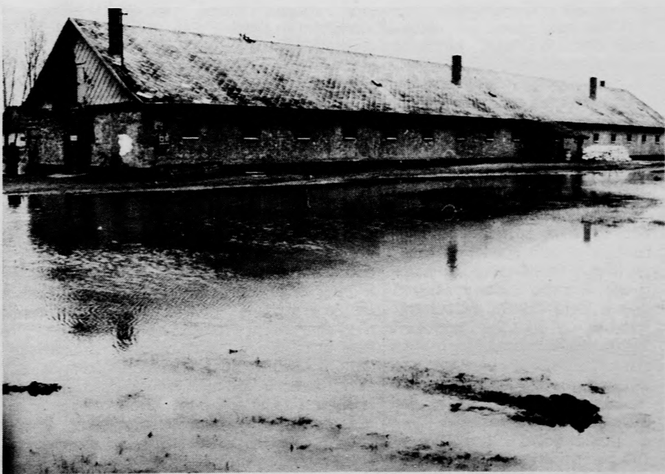
Belvízben álló majorsági épület Nyírbrány szélén

A száraz, napos időjárás, a belvízgyűjtő fűcsatornák vízszintjeinek csökkenése és a folyamatosan végzett belvízszivattyúzás hatására az igazgatóság területén március 20-a után közel 6000 hektárral csökkent a belvíz-elöntés. Sokk mezőgazdasági üzem végez belvíz-elvezetési munkát. Az igazgatóság területén továbbra is másodfokú a belvízvédelmi készültség.