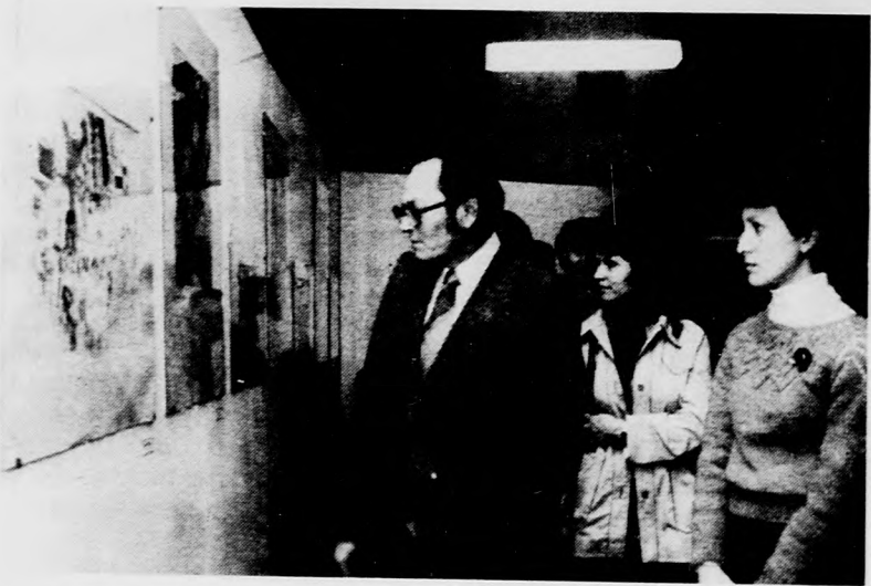
„Valóságértékű a műveken ábrázolt képzeletvilág”