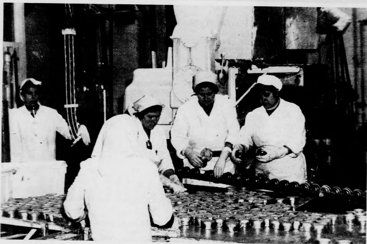
Dobozolás után a szalagokról leszedik a vagdalt húst

dobozolás következik, majd innen a tartósítósó kerül a konzerv. Ezen a szalagon készítik a májkrémet is, melyből mászakonként 90 ezer doboz hagyja el a szalagot.