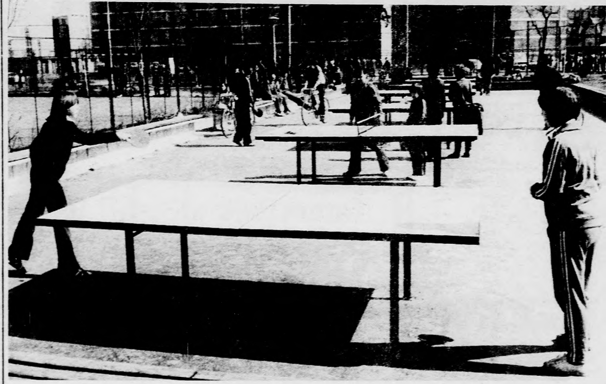
Benépesült a Barátság park

lalkozásait. A lakótelepi sportegyesület férfi és női kondicionális tornatanfolyamokat indít ősztől. A három legnagyobb lakótelep külön programot is készített. A Fényes udvariak a Nagy-Sándor-lakótelep sportolóival szerveznek barátságos mérkőzéseket, s (többek között) pallagi kerékpártúra, Vekeri-tavi gyalogséta, októbertől pedig tokaji autóbussz-kirándulás csalogatja a telep lakóit. A vénkertiek kerékpáros és autós ügyességi versennyel, lépcsőházak közötti labdarúgó tornával szerepelnek a különlegességek listáján, s itt is, akárcsak az Újkerben szinte minden hét végére akad valamilyen szervezett tömegsportrendezvény.