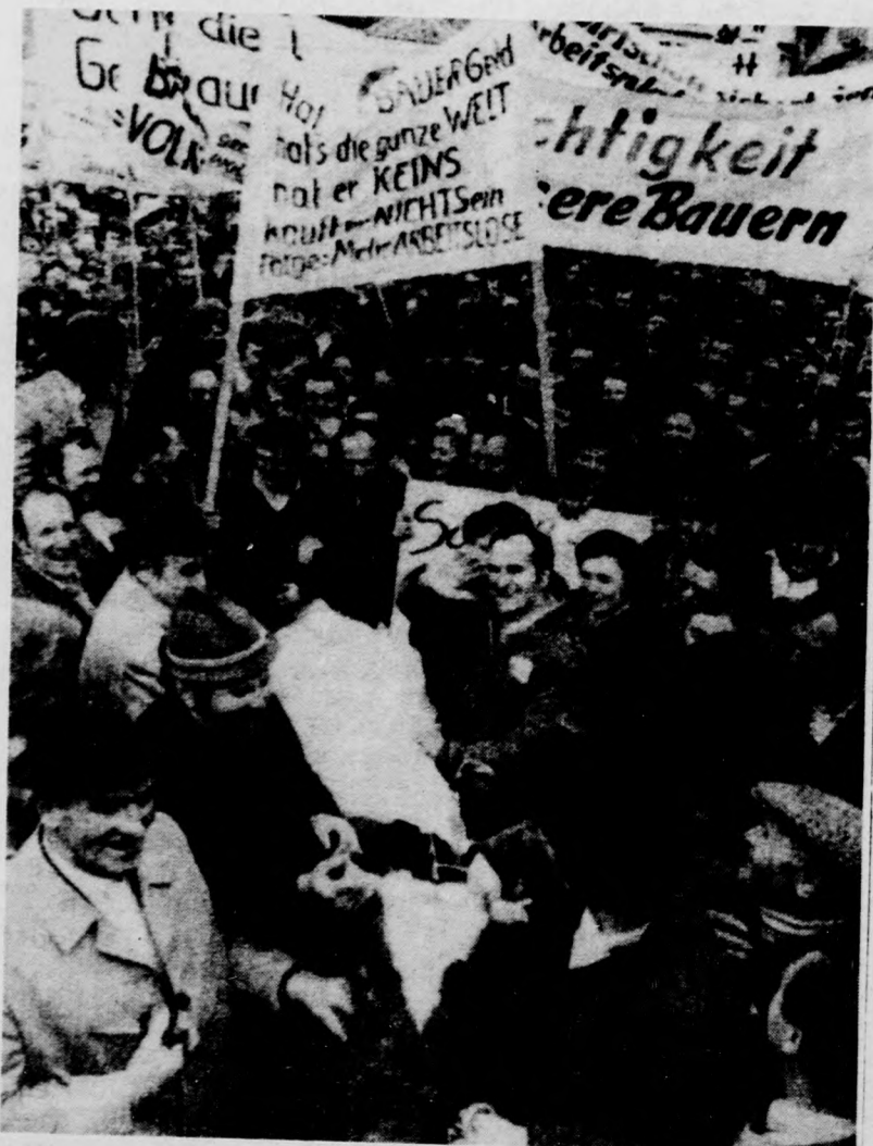
Bonnban körülbelül 20 ezer paraszt vett részt azon a tüntetésen, ahol a Közös Piac mezőgazdasági politikája ellen tiltakoztak. Képünkön: a felvonulók a táblák mellett egy tehenet is magukkal vitték a menet élén.

Március 28-án, szombaton a nő- és rétegpolitikai munka időszerű kérdései, illetve gazdaságpolitikai feladatok és a városrendezés helyzete szerepel a tanfolyam napirendjén. Holnap, március 29-én a szocialista demokrácia és a lakóhelyi közérzet időszerű kérdéseivel, illetve a népfrentbizottságokra háruló legfontosabb feladatokkal ismerkednek a népfrent-tisztségviselők Hajdúszoboszlón.