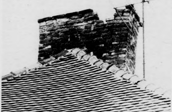
...de csak addig, amíg a fejünkre nem esik. A kémény Debrecenben, a Vörös Hadsereg útja és a Bajcsy-Zsilinszky utca sarkán levő ház tetején található (egyelőre)