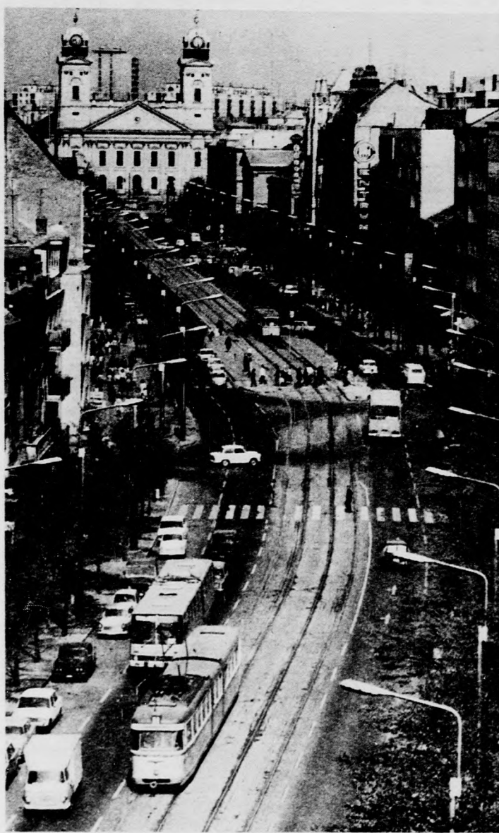
A Vörös Hadsereg útja, a májusban kezdődő munkálatok színtere

A pozitív változásban reménykedve marad tehát a lakosság türelme, megértése. Jó előre tudni, hogy a villamospálya-fektetési munkálatok lesznek kísérő mozzanatai is. Egyik ilyen következmény, hogy az említett magasságkülönbséget új aszfalt-szönggyel egyenlítik ki. Ezzel új aszfaltburkolatot kap a Vörös Hadsereg útja 1100 mé-