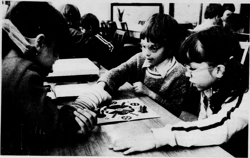
„Ne nevesd korán!” — társasjáték izgalma nem is fakaszt mosolyt az úttörőházban, a napközisek foglalkozásán