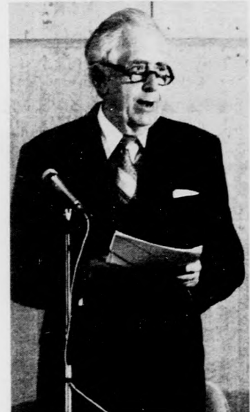
Dr. Szentágothai János mondott ünnepi beszédet