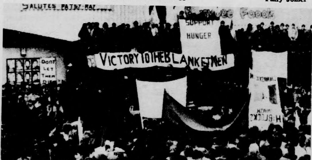
Észak-Írországban változatlanul feszült a belpolitikai helyzet. Képpünkön: tömeggyűlés Belfast városában

A közgazdászhetet rendezvénysorozatát május 9-én 11 órakor zárják a TIT tanácstermében A keresztszabályozás és a vállalatok termelésfejlesztéséről dr. Szikszay Béla, az MSZMP KB osztályvezető-helyettese lesz.