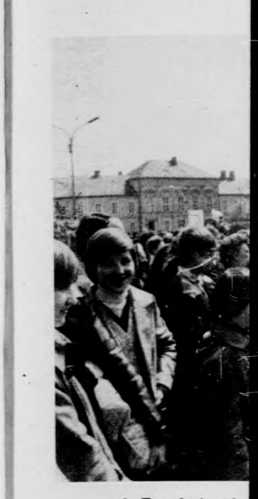
A Bocskai tér