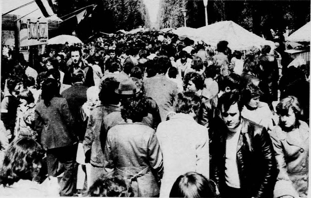
Finom falatok, mozgóbüfé és bazárok marasztalták a sétálókat a Nagyerdőn

A kulturális és sportrendezvények szombatban is folytatódtak, s ma is sokszínű programajánlatból válogathatnak az érdeklődők.