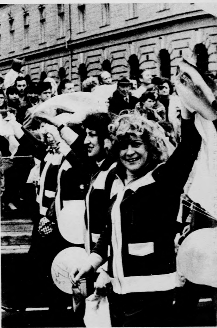
Érdeklődők és felvonulók