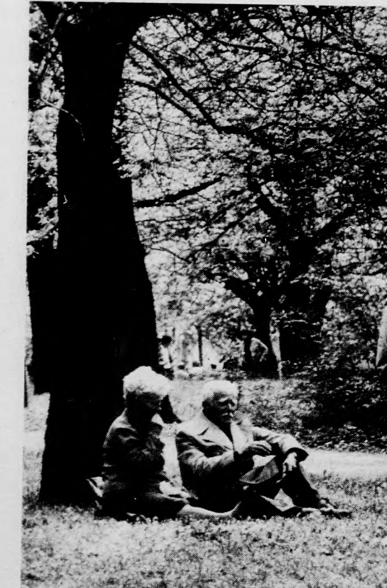
Jólesik a pihenés