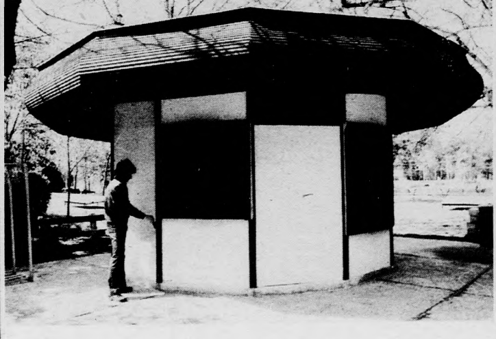
Az idei nyáron bővül a vendéglátó szolgáltatás: új baromficsárdát adtak át

ÚJ SZÖVETKEZETI TAGOK. 87 új taggal gyarapodott egy év alatt a társascegei ÁFESZ. A belépők közül a szocialista brigádok 53, a kiváló egységek dolgozói pedig 24 főt nyertek meg a mozgalomnak.