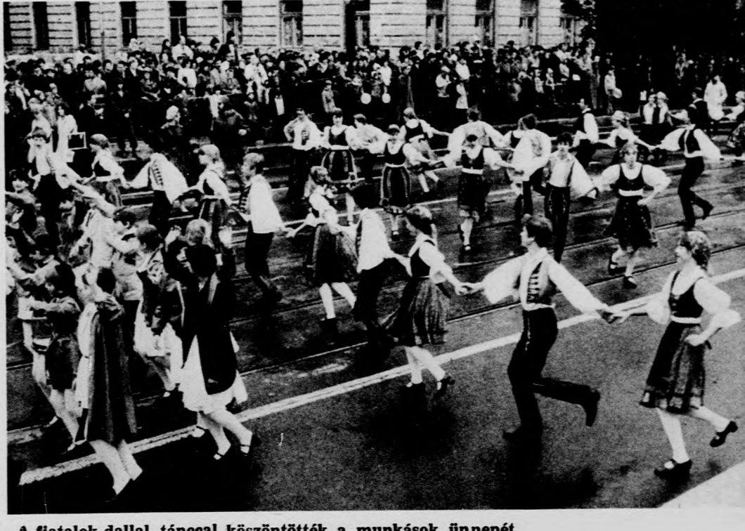
A fiatalok dallal, tánccal köszöntötték a munkások ünnepét