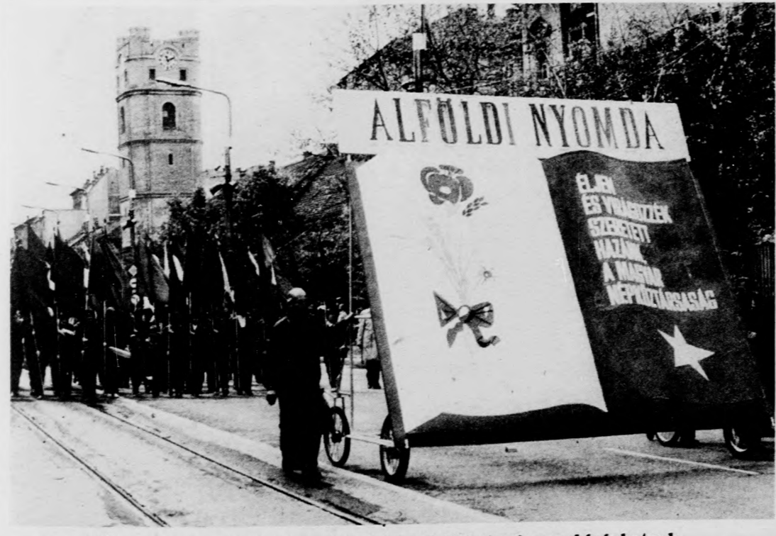
Az Alföldi Nyomda nyitott könyvében írtaknál többet mi sem kívánhatunk