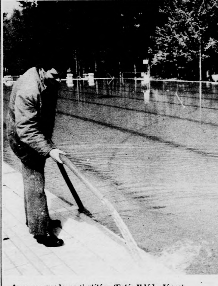
A versenymedence tisztítása