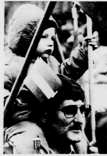
A helyzet magaslatán

A MEDICOR Művek debreceni orvosműszergyárának munkás kollektívája nagy szerepet vállalt a MEDICOR sikereiben, amelyek külföldön is elismerést szereztek az ipárnak. A MEDICOR Műveknek adományozott magas szintű kitüntetésekben a debreceni gyár felvonuló dolgozói is kiemelkedő szerepet vállaltak.