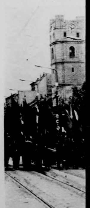
Az Állami Nyomda

Debrecen arcultán formálásában, a korszerű lakótelepek létrehozása nagy szerepet vállalt a Hajdú megyei Állami Tőzpari Vállalat, akik elnyerték a Kiváló vállalat címet. Szinte egy időben vehette vállalat dolgozója, Z