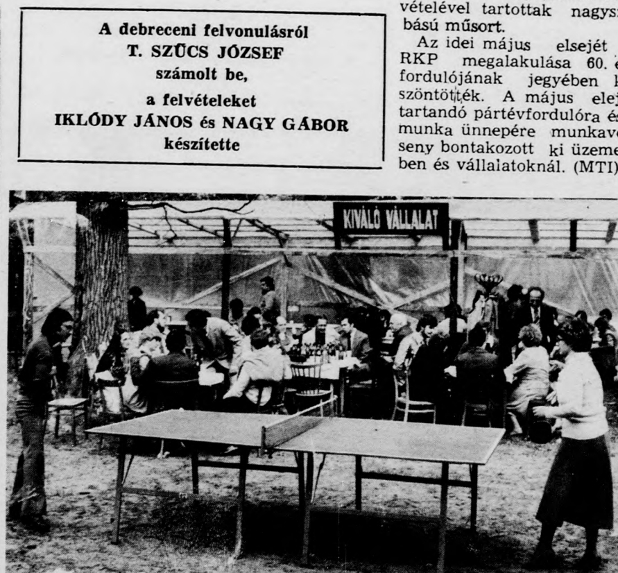
Vajon ki nyert? A zöldellő fák alatt heves pingpongeszták is dúltak