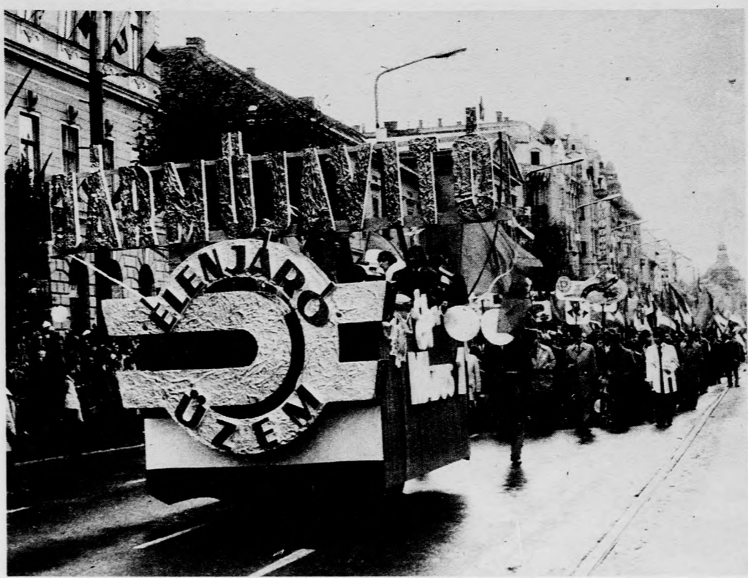
Dekoratív kocsit hordta, hogy a mögötte haladók a MÁV Járműjavító élenjáró üzemeinek élenjáró munkásai

Az Orvostudományi Egyetem dolgozói, hallgatói vonultak el ezután. A mostani és leendő orvosok, az egész