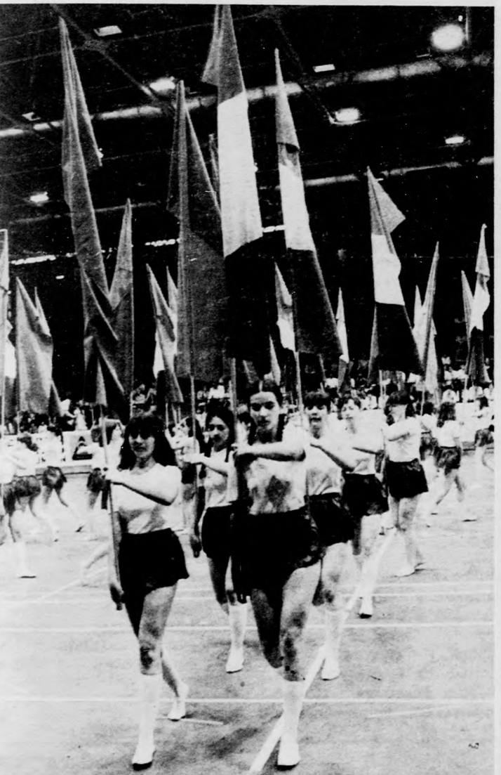
A sportesernokban rendezett gálaműsor egyik pillanata

Szocialista jövőnk ígé- retei azok a gyermekek, akik az úttörők és kisdobosok há- romszögletű nyakkendőjét viselik. Megyénk iskolásai közül 67 ezer úttörő és kis- dobos vesz részt az úttörő- csapatok munkájában. Sok száz ifjúvezető és több ezer felnőtt — többségükben pe- dagógus — irányításával dol- goznak. Tisztelet és elisme- rés illeti azokat a vezetőket, akik vállalják és végzik ezt a nem könnyű, nagy felelős- séggel járó feladatot. Ok azok, akik a mozgalmi, úttö- rővezetői munkát nem fog- lalkozásnak, hanem a szó igaz és nemes értelmében hivatásnak tekintik! Az ünnepi beszéd elhang- zása után kitüntetések ad- tak át az elmúlt harmincöt évben a megye úttörőmoz- galomában legkiemelkedő- ben dolgozóknak.