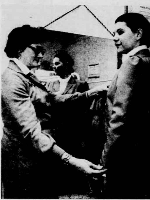
Új modelljeivel a világgazdaságra akar betörni a Debreceni Ruhagyár

A vállalat egyébként a lehetőségekhez igazodó rugalmas tervet készített az 1981—85 közötti időszakra. Szeretnének a textil- konfekcionálásban is nagyobb termékfel- tást elérni, de ennek éppen a már említett alapanyag körüli huzavona az egyik akadá- ly. A kurrens cikkekért nagy a harc, s amíg egy gyár vagy üzem nem tud nagy té- telben vásárolni, a kereskedelemlhez kell fordulnia. Ott viszont csak kevés anyagot kap, s ez megakadályozza az előbbelrele- pben.