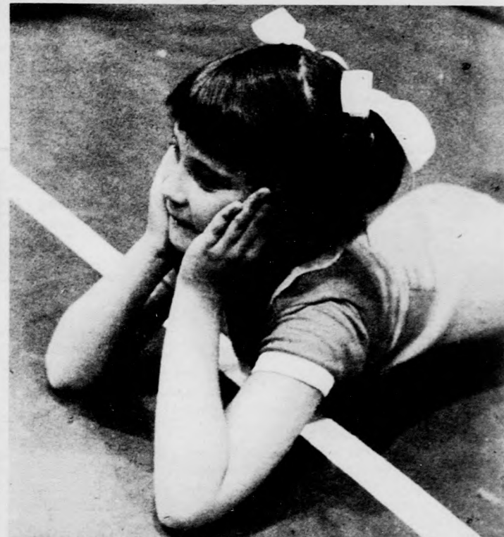
„Na most mi lesz?”