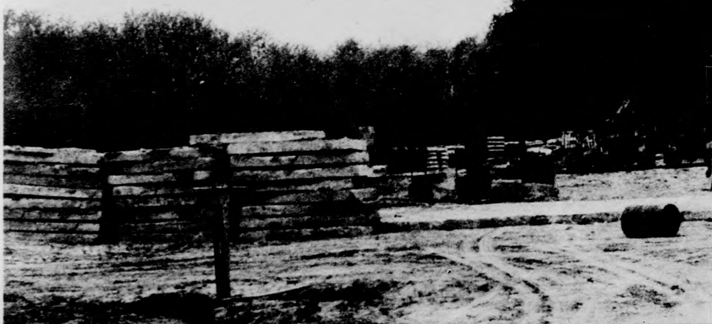
Alapozás előtt a BIOGAL és a svájci ZYMA közös üzeme Debrecenben

A BIOGAL hatodik ötéves tervében körülbelül 1,8 milliárd forintnyi beruházás szerepel. Ennek többségét, 1,3 milliárd forintot a tőkés piacon eladható termékek gyártásáért, importkiváltásért kapja a gyár. A megalapozott és reálisnak látszó fejlesztési elképzelések, külön-külön is kockázatot jelentenek.