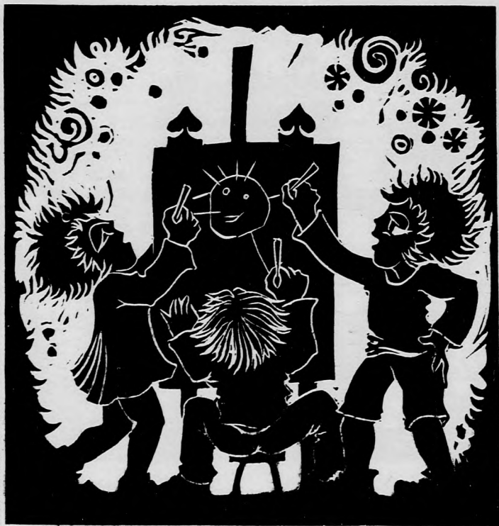
SZILÁGYI IMRE GRAFIKÁJA