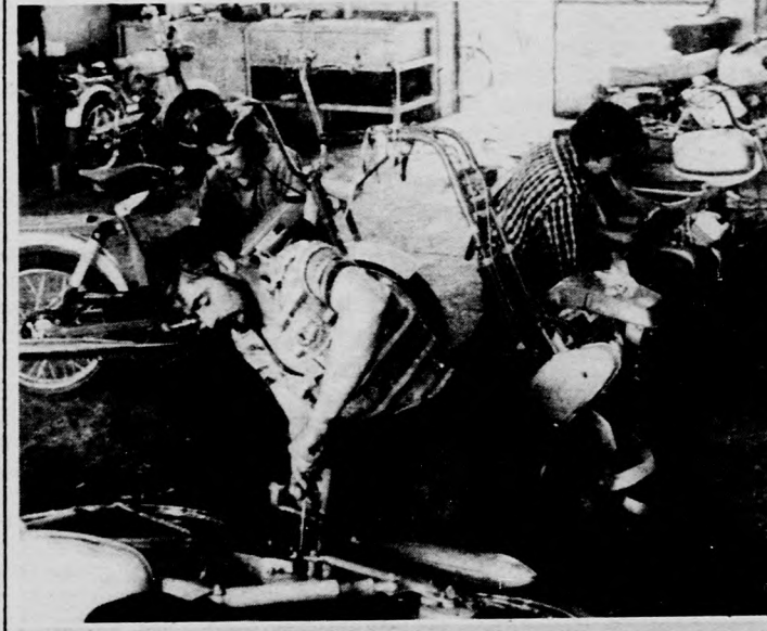
A motorszervizben mindig nagy a forgalom

Üzletpolitikai célkitűzéseik között iparcikk-kölcsönzés beindítása is szerepel, s közeli terveikben a vas- és fapari barkácsrészleg fejlesztése is helyet kapott.