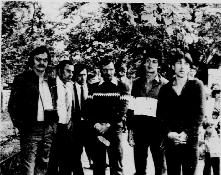
Néhányan az otthon régi...

gyerekek nevelőotthona. 1959-ben kettőtantermes, öt év múlva újabb négytantermes iskolaépület emelkedt az otthon területén. 1966-ban hatlakásos házat építettek a nevelőknek, ettől a tanévől kezdve nyolc tanulócsoporthoz, elsőtől nyolcadikig 195 gyerek tanul és él itt. A közelmúltban fejeződött be a kastély rekonstrukciója, több