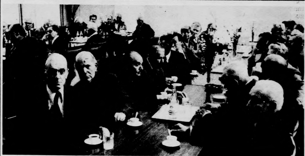
Veteránok a Debrecen városi pártbizottságon

mongol, mind a külföldi felzárkózás részéről — az amerikai és NATO-imperializmus mellett a szövetségesüké lett pekingi vezetési is komolyan veszélyeztetni. Végül tükrözte a kongresszus, hogy a mongol nép nagyra értékeli a Szovjetuniótól és a többi szocialista országtól kapott internacionalista segítségét, amely megkönnyíti gazdasági felzárkózását a Kolesónós Gazdasági Segítség Tanácsa többi országához. (MTI)