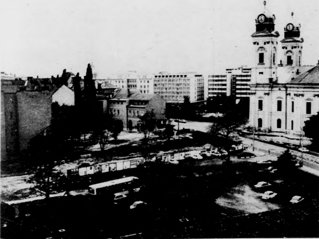
A Kálvin téren minden készen áll az üzletház építésének megkezdésére