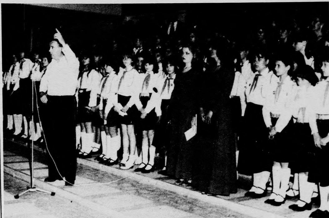
Az összevont kórus.