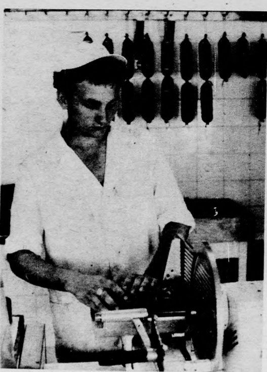
A kiváló ifjú szakmunkás munka közben

— Arra nem gondoltam, hogy az elsők között végezhetek, de úgy érzem, nagyon hátul sem fejezem be a versenyt. Ugy gondoltam, a középmezőnyben leszek. Mint említettem, az elmélet nagyon jól sikerült, a gyakorlat is a várakozástól eltérően, úgy „jött be”, ahogy álmodni sem mertem. A pontok