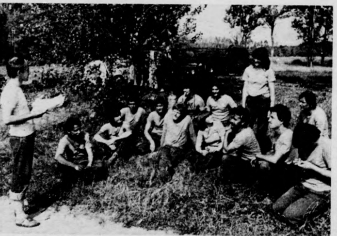
Ki tud a politikai kérdésekre pontosan válaszolni?

Az elmúlt hét második felében rendezte meg a fegyveres erők és testületek tevékeny közreműködésével a KISZ Hajdú-Bihar megyei Bizottsága és a megyei Ifjú Gárda-parancsnokság a X. megyei Ifjú Gárda-szemlét. A Vekeri-tó környékén rendezett erőpróbán bizonyulniuk kellett a fiatalok szellemi, fizikai erőnlétére. A kétnapos kerékpáros és gyalogos harci túra minden egyes állomásán más versenyszámban kellett megmérkőzniük, a politikai ismeretektől a lövészetig, az egészségügyi ismeretektől a polgári tudnivalóig különböző feladatokkal kellett megbirkóznunk. Kis képiportunk ezek egy-egy pillanatát örökítette meg.