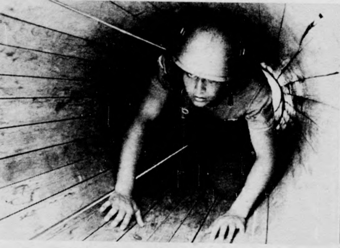
Bent a csőben...