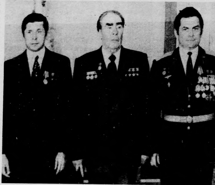
Leonid Brezsnyev magas kitüntetésekkel nyújtotta át a legutóbbi tartós űrrepülés két tagjának, Vlagyimir Kovaljonoknak és Viktor Szavinihnak

A Szovjet-Szaljut-program befejezésével kapcsolatban Brezsnyev megállapította: a végzett munka nagy eredményeket hozott. A geológusok, a meteorológusok, az erdőgazdálkodás és a mezőgazdaság, a talajjavítás és a halászat, a kohászat és a biológia szakértői máris a gyakorlatban használják fel a világűrbeli kapott információkat, s a kozmikus technika a lehető legközelebb