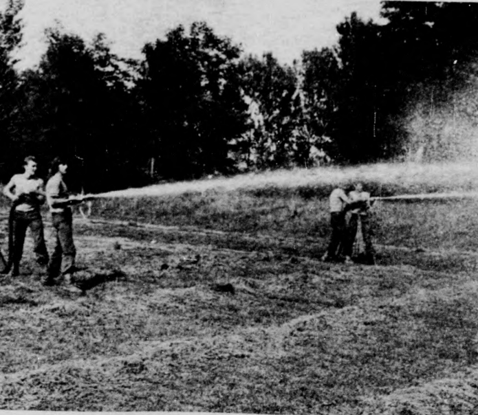
Cél a tűz!