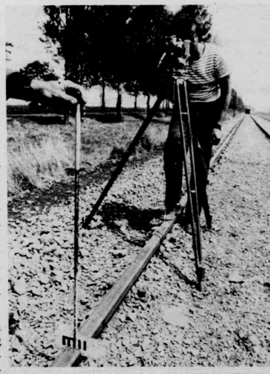
Az elkészült szakaszok szintezése engedhetetlen

veit is az építési főnökség szakemberei készítik, s jelenleg közel nyolcvan dolgozó a pályaszakaszokon. Leszedik a síneket, a régi ágyazatot szétterítik, tömörítik, majd az új ágyazat elkészítése után lefektetik a Budapest-Záhony közötti vasúti fővonalról kikerült, használt, de erre a pályaszakaszra még évekig alkalmas síneket. Egy kilométer pálya építése új anyagból több mint ötmillió forint. A használt sínek felhasználásával a költségek két és fél millió forintra csökkennek. A nagykereki vonal felújítása 1982-ben és 83-ban is folytatódik. Még a VI. ötéves terv folyamán a Sáránd-Létavértes közötti vasútvonalat is felújítják. Ebben az esztendőben a Debreceni Építési Főnökség különböző fő- és mellékvonalakon 60 kilométer hosszúságú vasútvonalat korszerűsít. Ezenkívül 130 kitérőt újítanak fel.