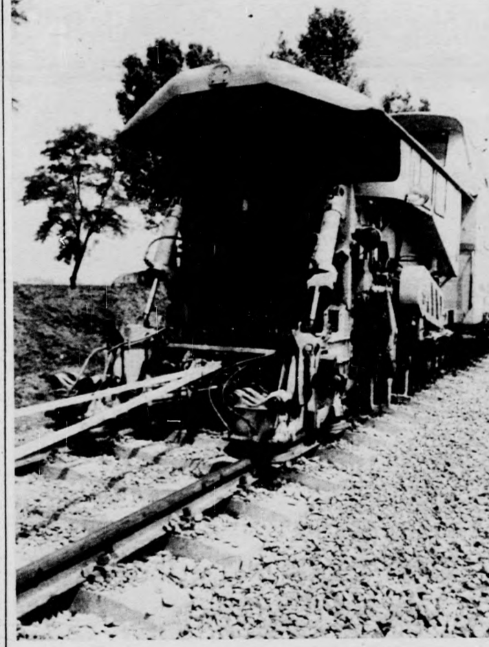
Munkában a szintre emelő automata gép

Jelenleg vasútpótló autóbuszok szállítják az utasokat azokon a szakaszokon, ahol a pálya korszerűsítése miatt nem közlekedhetnek a vonatok. Így a Sáránd-Nagykereki közötti szakasz egy részén és a debrecen-füzesabonyi vasútvonal egy részén a 6-os Volán autóbuszai szállítják az utasokat. Az autóbuszokat alkalmanként az építési főnökség járműparkjának autóbuzsai helyettesítik. 240 közúti járműve van a főnökségnek, ezek jelentős része a vasúti pályák korszerűsítéséhez szükséges anyagot szállítja.