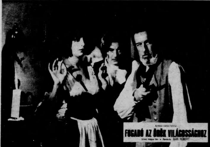
Fogadó az Örök Világosságához

Vetítik: Apolló délelőtt 22—24., Horváth Árpád 21., Meteor 22—24., Vig délelőtt 20—21.