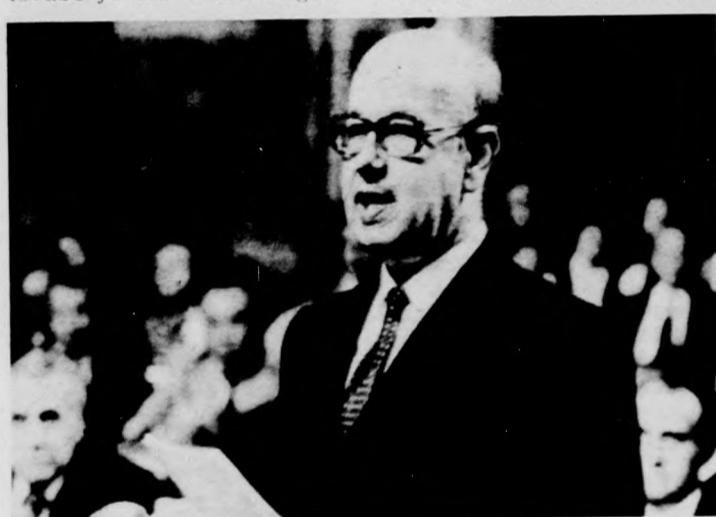
Hetényi István pénzügyminiszter expozéját tartja

Apró Antal bejelentette, hogy a Minisztertanács megbízásából Hetényi István pénzügyminiszter benyújtotta a Magyar Népköztársaság 1980. évi költségvetésének és a tanácsok 1976–1980. évi pénzügyi tervének végrehajtásáról szóló törvényjavaslatot. Az országgyűlés ezután elfogadta az ülésszak tárgysorozatát.