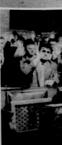
Szavaz az országgy