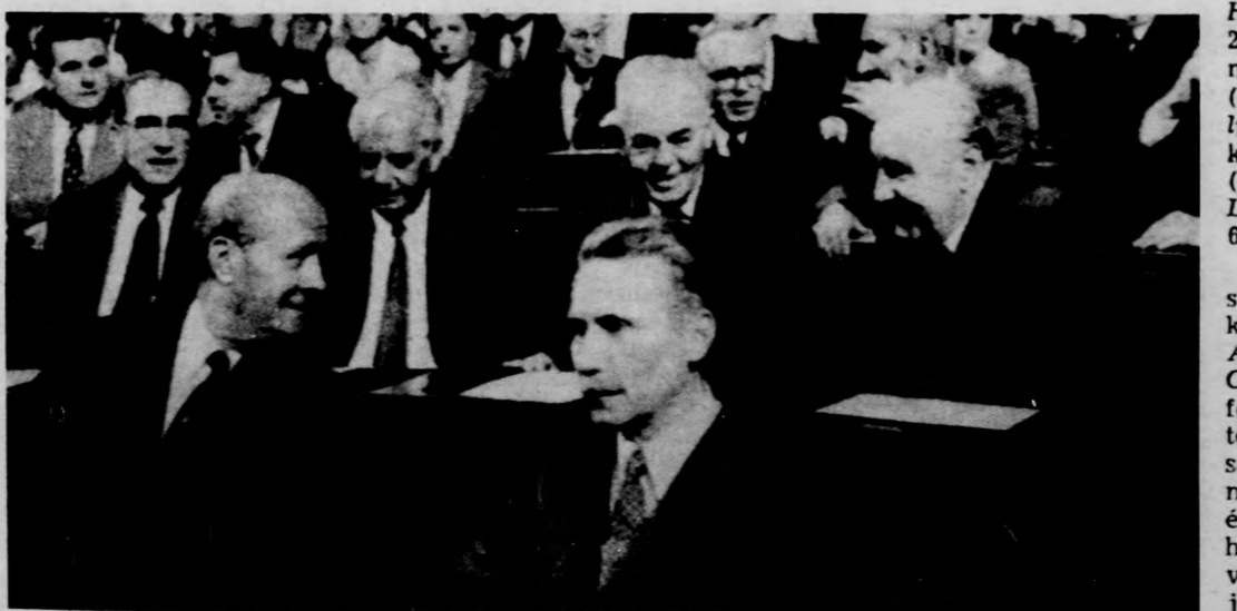
Párt- és állami vezetők az ülés közben

Az NDK törvény- elnöke továbbra- Sindermann. A népi kamar- ülésén újabb Willi S- NSZEP KB politik- ságának tagját vá-