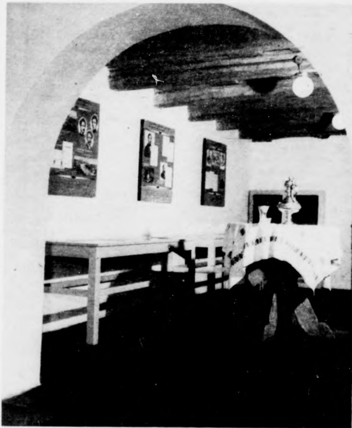
Részlet a múzeumból

haladó, nehezen járható országút mentén terül el a Kis- és Nagy-Mohostó természetvédelmi területe, öt holdnyi különleges mocsári és láp növényzettel, dús tőzegmohaláppal. Ezek a tavak a jégkorszak végén földcsuszamlással keletkeztek. Az azóta egyre vastagodó tőzegmohalápok a jégkorszak néhány ritka növényét is megőrizték. Miután e természeti ritkaságban gyönyörködtünk, néhány kilométernyi út megtétele után máris az irodalmi nevezetességű kisközségbe, Kelemérré érkezünk.