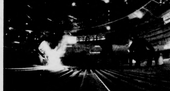
A CSÖSZER szakemberei szerelik a küzdőtér hűtő- és fűtőcsőrendszerét