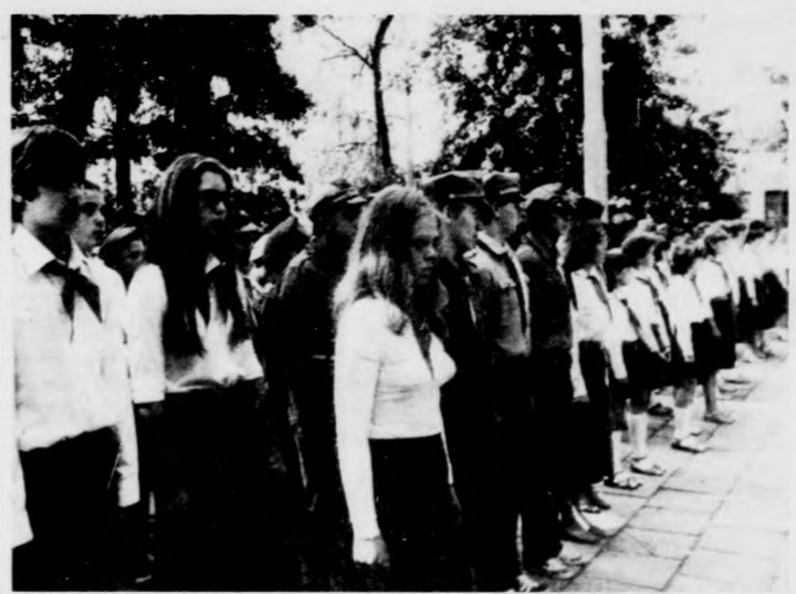
Felsorakoztak a rajok az ünnepélyes tábornyitóra

Háromnapos Hajdú-Bihar megyei látogatásra érkezett június 30-án Karakas László, az MSZMP KB tagja, a Köz- ponti Bizottság osztályveze- tője, országgyűlési képviselő. Itt tartózkodása ideje alatt ellátogatott Polgárra, Hajdú- dorogra és Hajdúnánásra, ahol találkozott a város párt-, állami és társadalmi vezetőivel, valamint az ipari, mezőgazdasági üzemek dol- gozóival és kötetlen vagy fó- rumoszerű beszélgetéseken adott tájékoztatást az ország- gyűlés nyári ülészakán el- hangzott időszerű kérdése- kről. Június 30-án Polgáron az Építő- és Vegyesipari Szövet- kezetben és a November 7. Termelőszövetkezetben, jú- lius 1-én Hajdúdorogon a Bocskai és Új Élet Termelő- szövetkezetbe tett látoga- tást. Július 2-án pedig Haj- dúnánáson a Tedeji Állami Gazdaságot és a Béke Ter- melőszövetkezetet kereste fel. Karakas László július 2-án az esti órákban utazott el megyénkből.