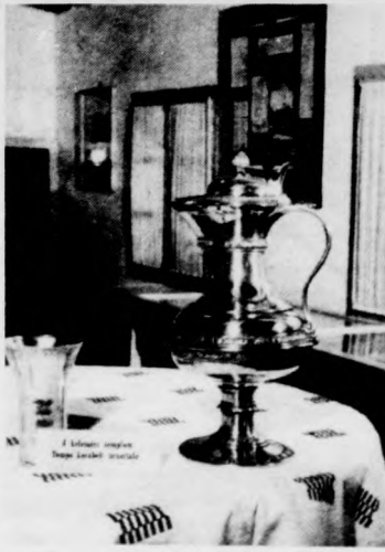
Egyházi edények a múzeumban

Tompa Mihály, a beteges, hanyatott sorsú költő 1849. áprilisától élt Keleméren. Aztán, hogy mint nemzetőr-lelkész részt vett a szabadságharcban, s csak súlyos betegsége miatt vált meg a honvédseregtől. Kelemérré költözött, ami-