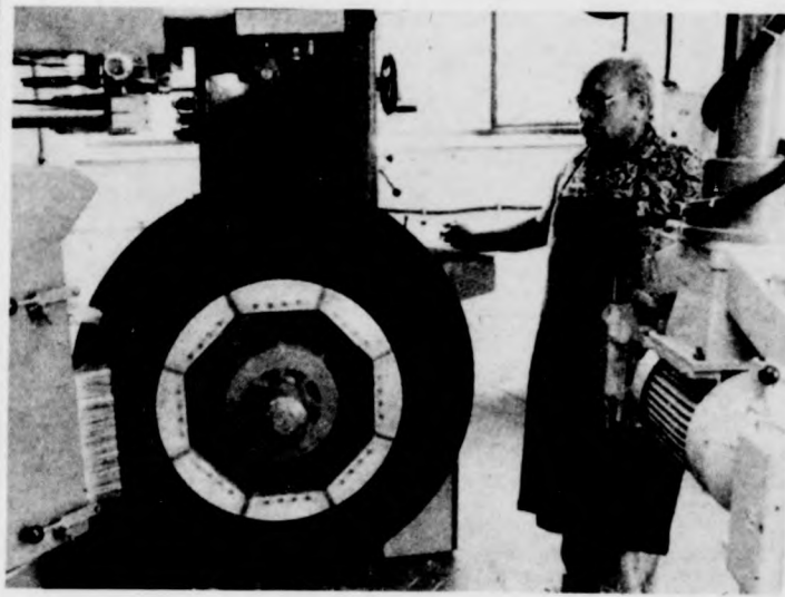
Az első mozzanat: „leradirozzák” a régi futófelületet