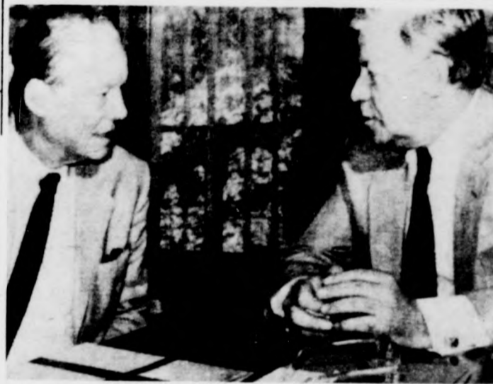
Willy Brandt Bonnban kedden tájékoztatta Helmut Schmidt nyugatnémet kancellárt moszkvai tárgyalásairól.

Művelődési Minisztérium Magyar Írók Szövetsége