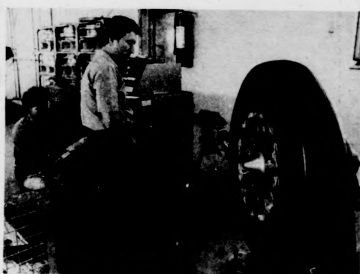
Az adagológép „felrakja” a nyers gumit