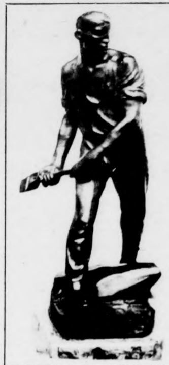
Bányászszobor Meniére műhelyéből

A rekonstrukció előtt az első emelet néhány értékes traktusa a szomszédos épülethez tartozott, most ez is a múzeumot gazdagítja. Feltárták a korábban betemetett