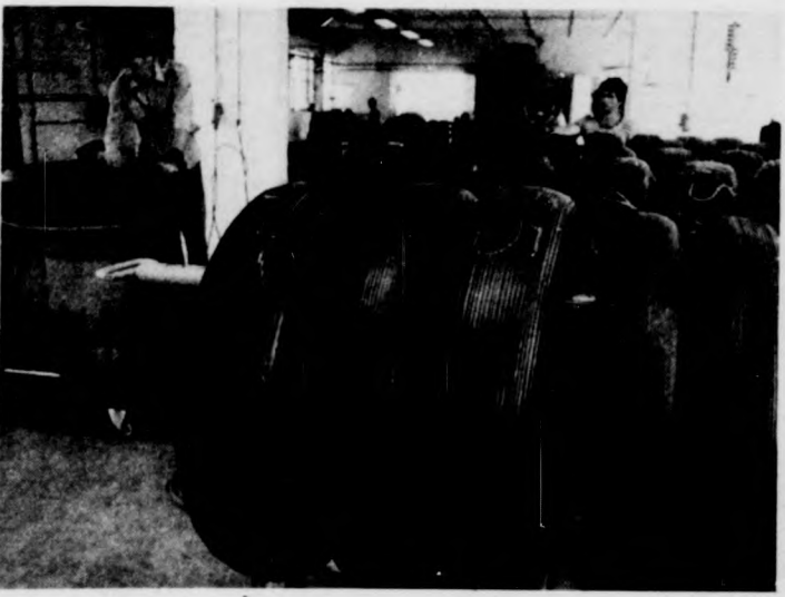
A kerekeket előkészítik a sütéshez