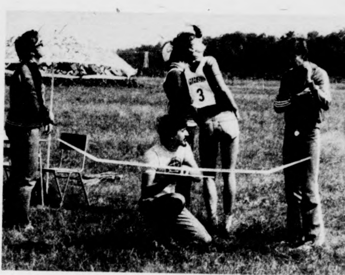
A rajt pillanata

— A körrepülő modellekkel a papírfőforma érvényesült, a dobogón végzett három gyulai versenyző azóta már elutazott az Európa-bajnokságra. A szabadon repülő gépekkel, mint említettük, az időjárás módosította az eredményeket, mindenki óvatosan versenyzett, igyekezett rövid repülésre beállítani modeljét, így elmaradtak a ma-