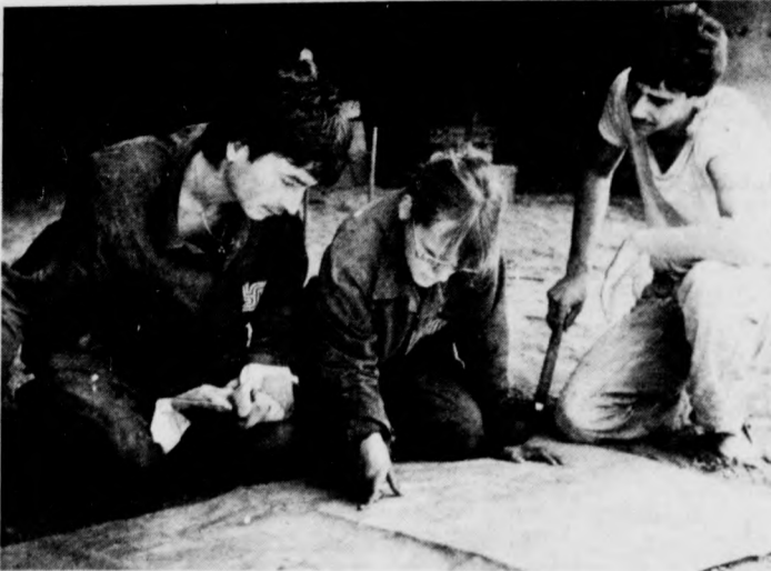
I. éves hallgatók munka közben

Az élő tyúk 34-36, az élő csirke 45-58, a sovány élő kacsa 42-52, a vágott csirke 65-70, a vágott tyúk 60-65 forint kilónként. A tojás darabja 2-2,20. A tejfő és a tehéntúró egyaránt 60 forint, a sajt pedig 90 forint kilónként.