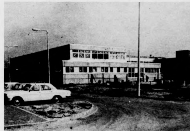
Az új városellátó tejüzem.

Újabb létesítményekkel gazdagodik az idén Debrecen, amelyek közül néhánynak a kivitelezője a Kelet-magyarországi Közmű- és Mélyépítő Vállalat.