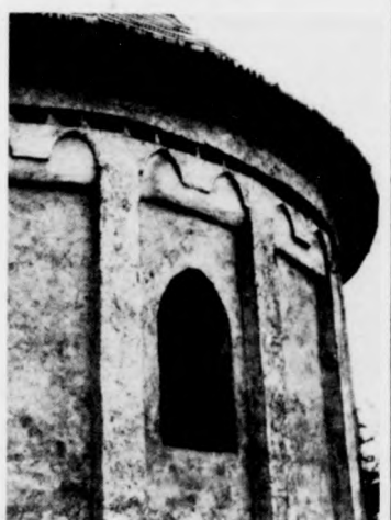
A középkori templom lizenciákkal tagolt, íves ablakú szentélye

S mögötte a völgy lapálya a déli messzeségbe vész, míg keletre a láthatárt a jól behatárolt domborsó zárja le. Egységes, zárt kis világ rajzolódik ki, amelyben a szentlászlói barátok s még régebb-