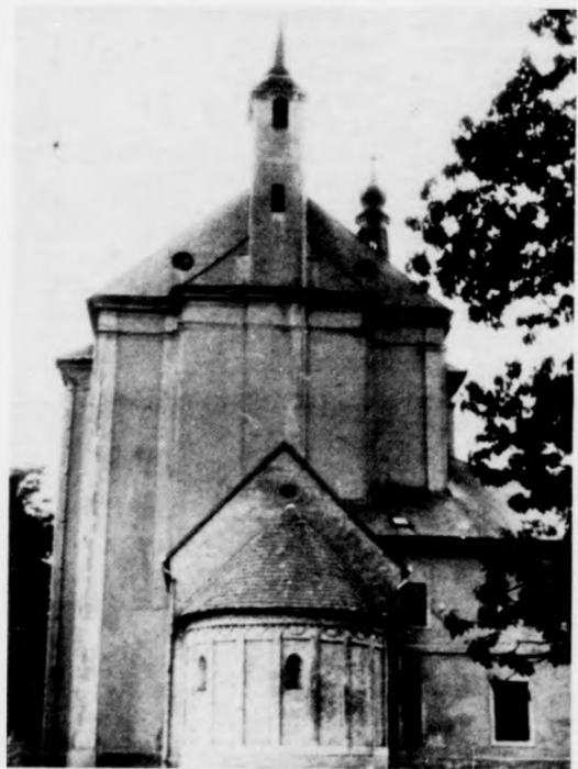
A templom és a rendház épületegyüttese hátulról: alul a kis középkori templom felkőr alaprajzi szentélyével, a barokk templom szentélyét a huszártorony zárja le, s a háttérben látszik a fő homlokzatú nagy torony barokk sisakja