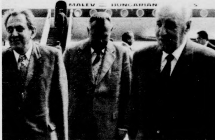
Kádár János a Ferihegyi repülőtéren Aczél György és Korom Mihály társaságában

A megye bemutatózó üzeméi, valamint az ózdi kereskedők egyaránt remélik, hogy ez a vásár is szélesíteni fogja a gyárvaros és Hajdú-Bihar kapcsolatát.