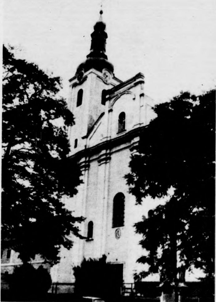
A búcsúszentlászlói templom fő homlokzata a toronnyal s azon túl a bal felől csatlakozó hajdani rendházzal

A barokk templomhoz még a XVIII. század első felében ugyancsak barokk stílusú emeletes rendház is épült — (ma szociális otthon). Szép, egységes a homlokzati képek nyugat felől. Érdekes tömböt