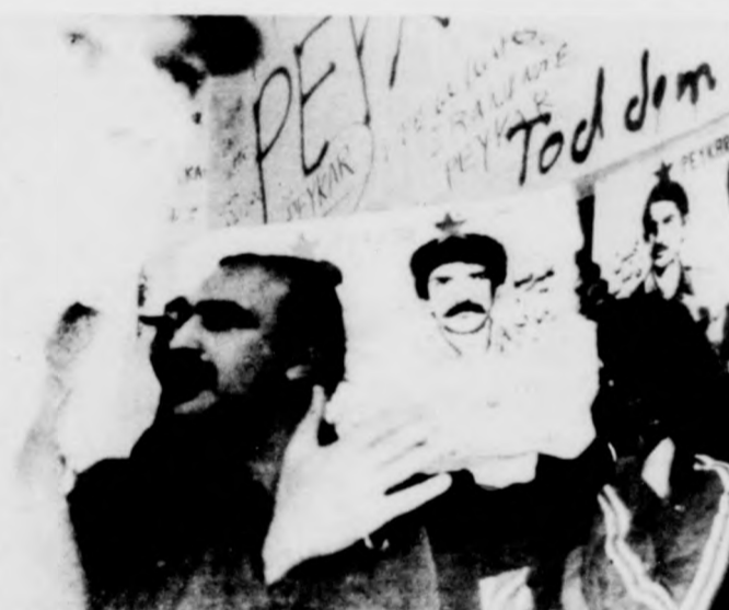
Iráni diákok rövid időre elfoglalták hazájuk brüsszeli, illetve hágai nagykövetségét, hogy tiltakozzanak az iráni kivégzések ellen. Képzünk a hágai követségen készült. A diákokat a rendőrség őrizetbe vette.