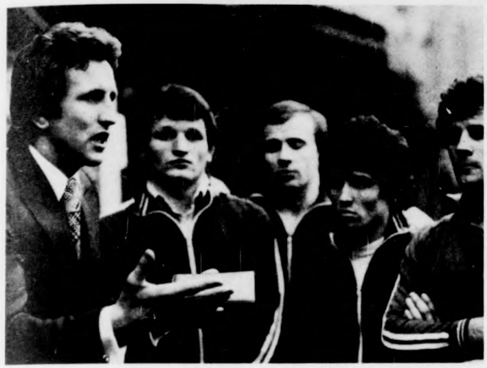
Az edző és versenyző viszonya felmérhetetlenül több, mint hűvös szakmai kapcsolat. A kép alighanem önmagáért beszél

Akadnak mindig pesszimisták, akik elcsodálkozva egy-egy nagy eredményen, kijelentették: „Ezt már nem lehet felülmúlni, ez már az ember teljesítményének határa!” És voltak és lesznek is mindig olyanok, akik még a legkihívatóbbnak tűnő teljesítmény elérésére is vállalkoznak. Amikor Herbert Elliot, az ausztrál csodafutó megjelent a római olimpián, biztos esélyesnek tartották az 1500 méteres futást. Edzőjét, aki ilyen csodafutót várt, nem ismerték. Kizárták még a pályáról is. Fentről, a lelátóról, törülközője heves lengé-