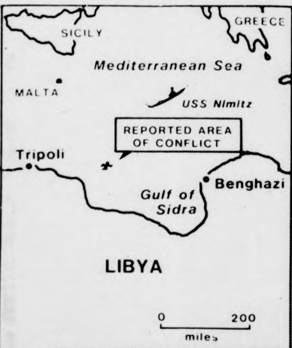
Az UPI amerikai hírügynökség térképe a provokáció színhelyéről