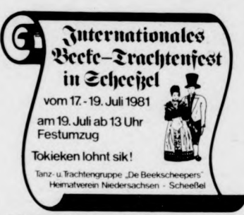
A nemzetközi folklórfesztivál emblémája

A fesztivál a résztvevők színpompás felvonulásával kezdődött. A menettáncokkal színesített karaván a nézők ezrei között vonult végig a szűk scheesseli utcákon. S hiába csendült fel fülbema-