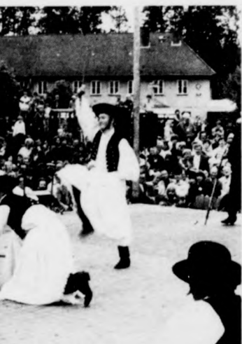
A fesztivált a „De Beekscheepers” táncosai szervezik évről évre