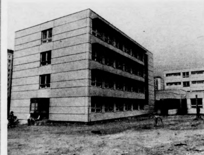
Az iskola kész, de a tereprendezés még hátravan

Szeptember elsején Debrecenben, az északnyugati lakótelepen, a Békéssy Béla utca általános iskolában nemcsak tanévnyitót, de iskolaavató ünnepséget is tartottak.