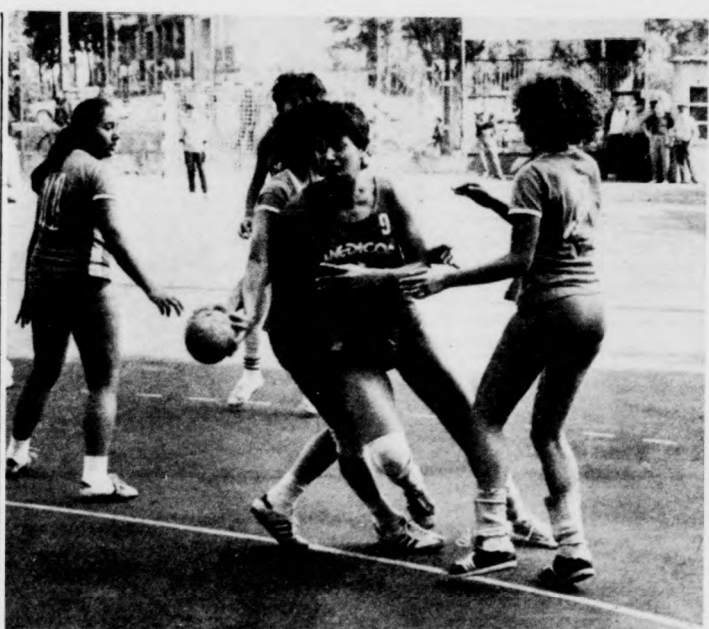
Levka (D. MEDICOR) igyekszik áttörni a fővárosiak védelmét a Lőrinci Főúti ellen játszott rangadón