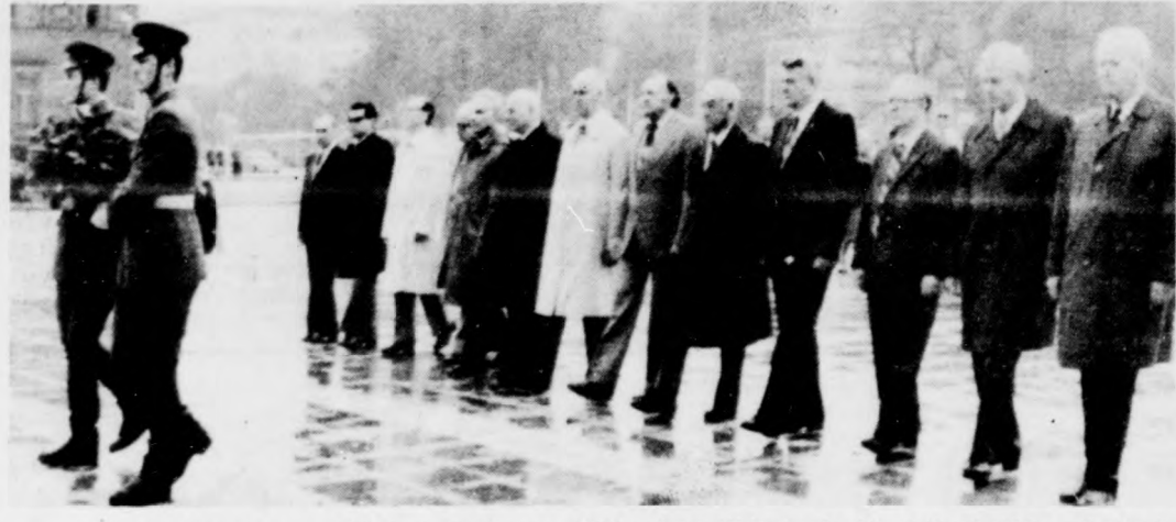
Az Ellenállók Nemzetközi Szövetsége (FIR) fennállásának 30. évfordulója alkalmából ünnepi ülést tartottak Budapesten. Képünkön: A résztvevők megkoszorúzzák a hősök emlékművét