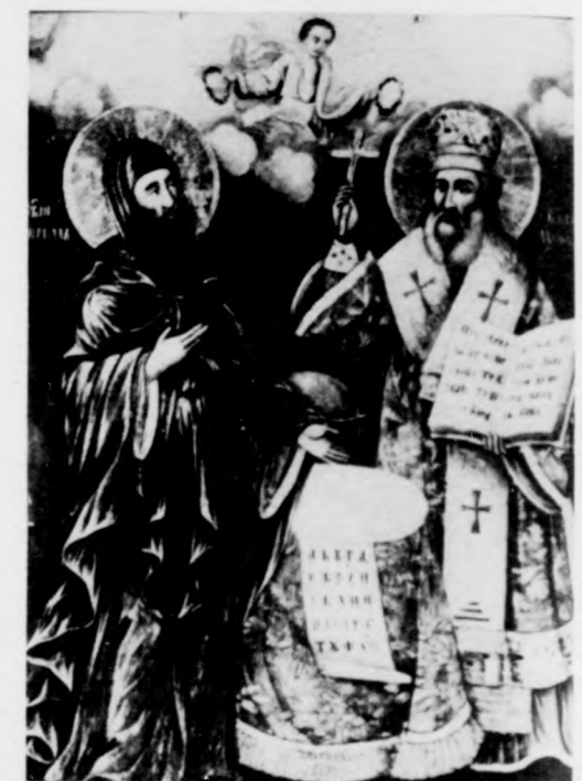
A bolgár történelem kiemelkedő szellemóriásai: Cirill és Metód, a szláv írásbeliség megteremtői — Ikon a Rila kolostorban. — A bolgár irodalom a legrégebb szláv irodalom. Kezdetei a IX. század második felére, Cirill és Metód működéséig nyúlnak vissza. A X. és a XI. században született kódexek az óbolgár irodalom fejlettségéről tanúskodnak. Képink az óbolgár irodalom egyik legszebb emléké, a gazdagon díszített Codex Assemanianust ábrázolja.