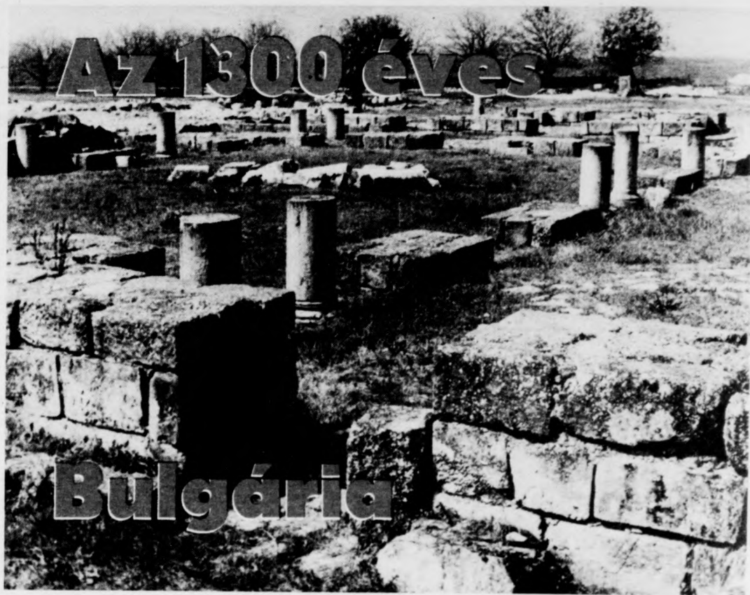
681-ben, 1300 évvel ezelőtt a Balkán-félsziget északi részén új állam született: Bulgária. A bolgár állam abban az időben Nagy Károly francia birodalma és a bizánci birodalom után a harmadik szervezett politikai hatalom volt Európában. Az I. bolgár birodalom történetében korszakalkotó lépés volt a kereszténység mint államvallás bevezetése. A képen: az első bolgár főváros, Plika bazilikájának romjai.

Sivítás szakította félbe. Reba rosszállan nézett a lila ajtófüggönyre, amely mögött verekedtek. Tompa utések hallatszottak, rekedt hangok, szitkok, kiáltások. Azután a függöny recsenve elszakadt és lehullott. A dolgozószobába berontott és négykézlábra rogyott egy véres állú, kopasz ember. A függöny mögül hatalmas mancek nyúltak ki, megragadták az embert a lábánál és visszahúzták. Rumata ráismert Budahra. Vadui kiabált. — Becsaptak!... Becsaptak!... Hiszen méreg volt! Miért?... Elhurcolták a sötéte. Egy fekete ruhás alak gyorsan felkapta és helyére akasztotta a függönyt. A beálló csendben undorító hangok hallatszottak a függöny mögül. Rumata mindent megértett. — Hol van Budah? — kérdezte élesen. — Mint látja, valami szerencsétlenség történt vele — válaszolt don Reba, de szemléletlenül zavarban volt. — Ne tegyen bolondá — mondta Rumata. — Hol van az igazi Budah? — Ah, don Rumata — felelte fejcsóválva don Reba. — Mit akar Budahról? Talán rokona? — Ide hallgasson. Reba! — mondta Rumata bőszen. — En nem tréfálok! Ha valami történik Budahnal, akkor maga megdöglik, mint a kutya. Eltiprom. — Nem lesz ideje hozzá — mondta gyorsan don Reba.