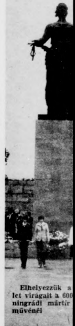
Elhelyezték a let virágait a 600 ningrádi mártír művéni

— Hát persze! I nak szánta, amiko észak Velencéjén gyarazza Nagy M tolmács, mindanny vnc idegenvezető Néva ágai, a folyó náok negyvenkét gyobb szigetet alk