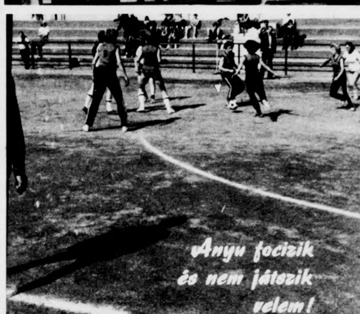
Anyu focizik és nem játszik velem!