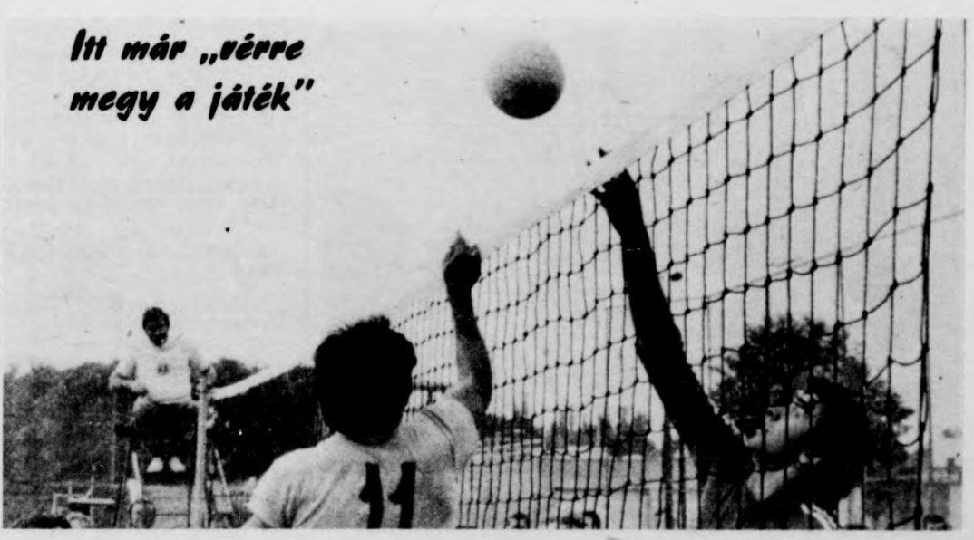
Itt már „vérre megy a játék”