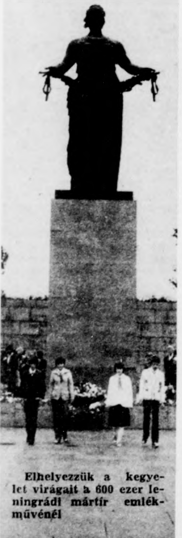
Elhelyezzük a kegye- let virágait a 600 ezer le- ningrádi mártír emlék- művénel

város vizeit háromszázhetven híd iveli át.