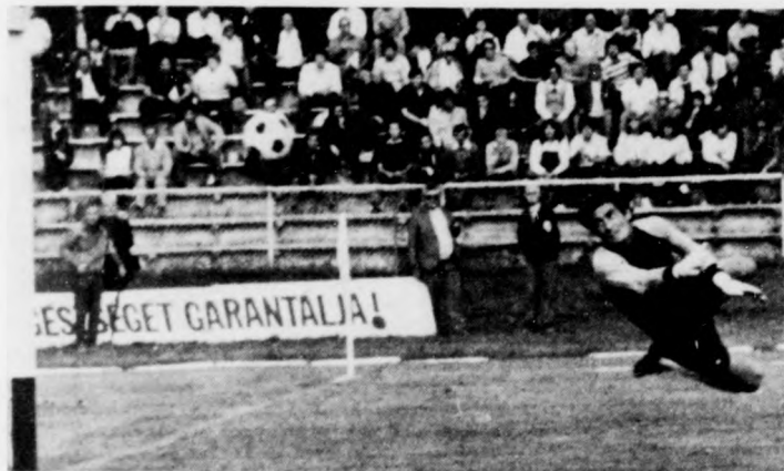
Kerekes nagy bombája utat talált a hálóba

Nyíregyháza-SZÉOL 2-1 (1-0). A látottak alapján az eredmény igazságos.