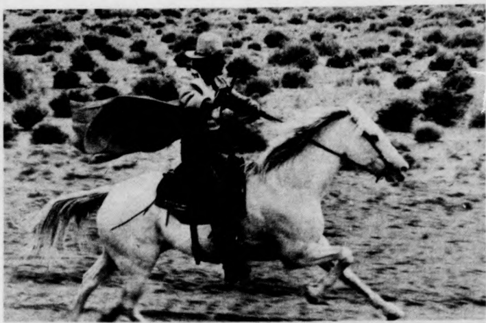
EGY ZSENI. KÉT HAVER. EGY BALEK