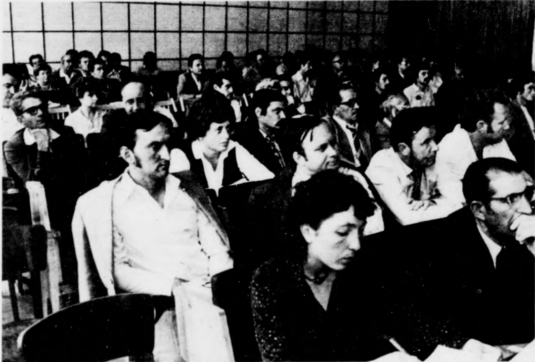
A résztvevők egy csoportja