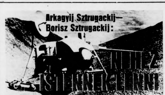
Arkagyij Sztrugackij - Borisz Sztrugackij

Az első világháborút ké seskönyvet ítéte el. A Krisztus előtt” 1915-ben í még a legjobb magyar í