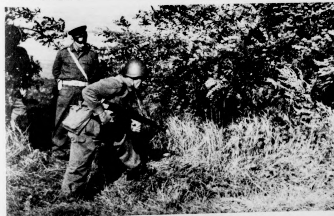
A harcászati gyakorlat egyik pillanata