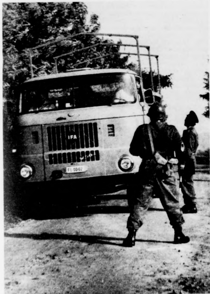
Nem szokványos, rutinellenőrzést kapott leneségre a fotóriporter: az említett harcászati gyakorlaton olyan elképzelt szituációt teremtettek, amely szerint diverzánsokat kell elfogni. A teherautón éppen egy ilyen ellenséges személy búj meg