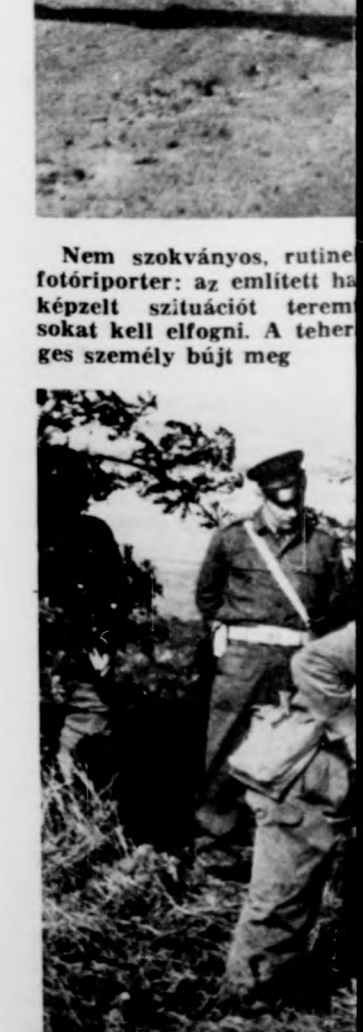
A harcászati gyakorlás

fotóriporter: az említett házképzelt szituációt teremtsenek kell elfogni. A teher ges személyi büjt meg