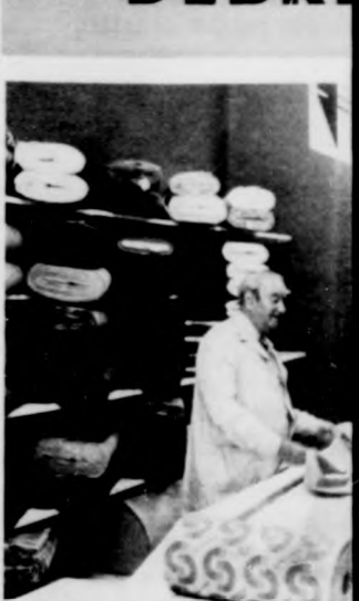
„Slágerbolt” jó áruval szerzéssel próbálják elősegi

Szeptember 10-én délelőt két árusító boltot nyitottak Hajdú-Bihar megyei Text ceni ÁFÉSZ közös üzemet letű boltjában méterárut, kesitene. Irhabundák, női a textilteljesítő vállalat tók az új üzletben.