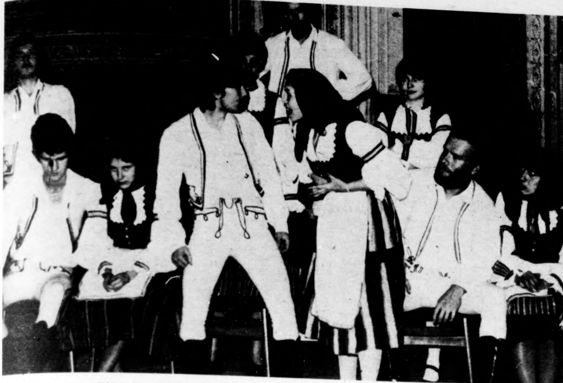
Jelenet az együttes Vadrózsák című előadásából