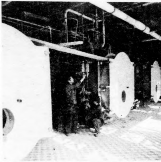
A kazánok körül még sok a teendő

Az új létesítménybe irányuló, illetve az onnan kiinduló szállításokra figyelve, idejé-