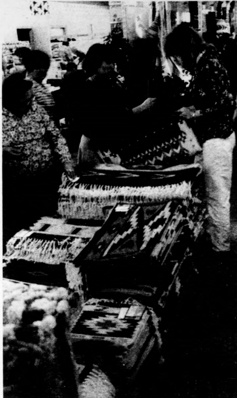
A Békésszentandrási Szőnyegszövő Háziipari Szövetkezet kézi csomózású perzsa és torontáli szőnyeget is kiállított

Már az első napon sokan vásárolták a szarvasi Szírén