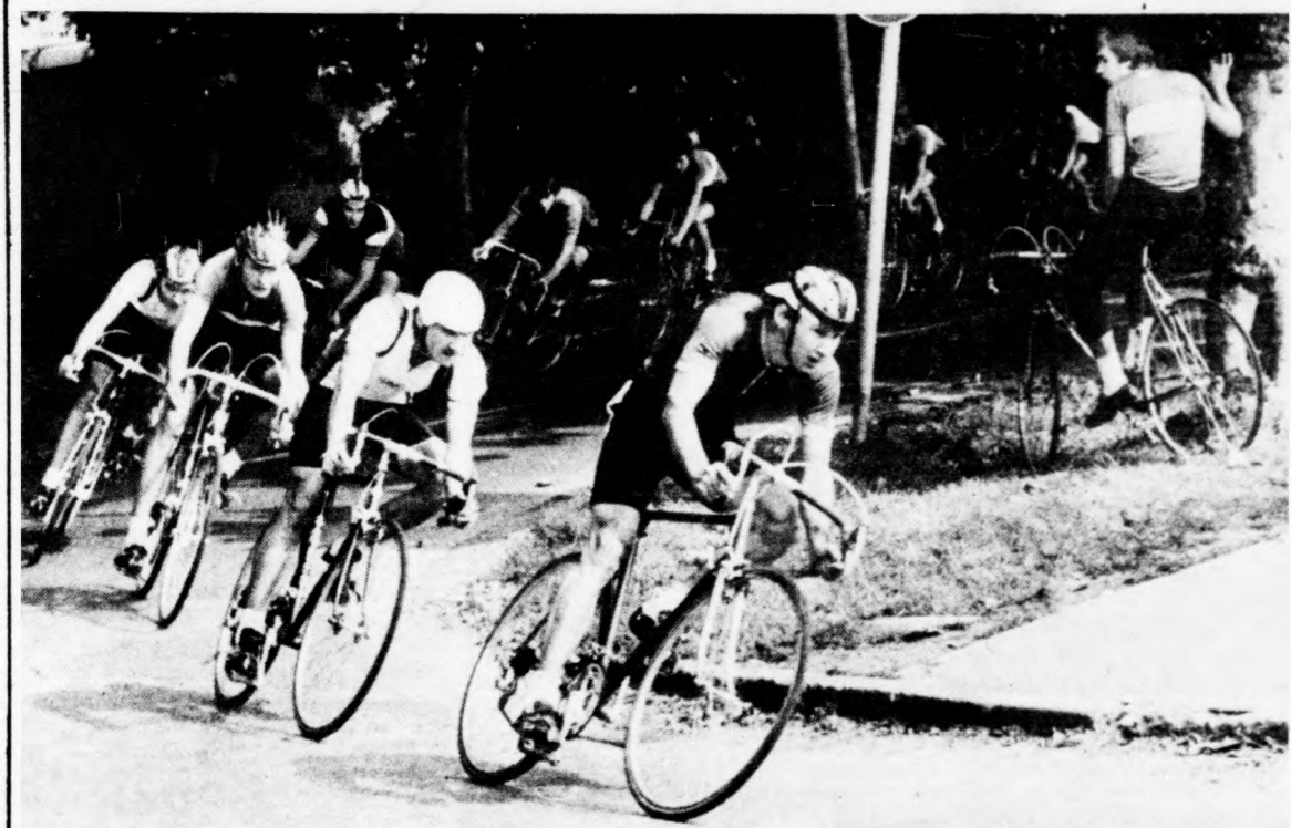
A Nagyerdő útvonalán — a felnőttek mezőnye

Az egyesületek közti pontversenyben, a Főnix Kupáért: 1. Debreceni Sportiskola 38, 2. Pécsi MSC 31, 3. Szegedi Építők Spartacus 21 ponttal.