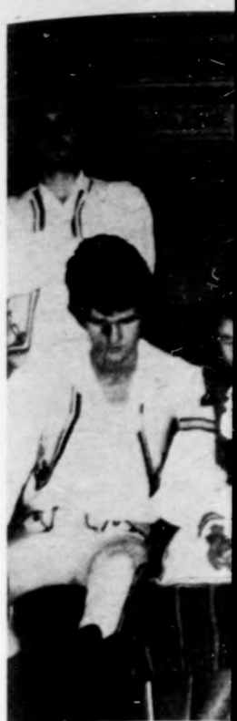
Jelenet az együtt

lemmel kísérsni a döntőbizottsági tisztségviselőket továbbképzésére biztosítani kell a képzését. A tanfolyamon való megjelenést rendszeresen elnököknek, elnökhelyetteseinek, és tagjainak rendszeres továbbképzését. Ennek fő formája a szervezett tanfolyami továbbképzés. A munkáltaó köteles elősegíteni és figye-