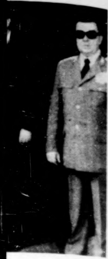
Mínisztertanács Parlamentünkön: Loson-

kitüntetésben, atóan teljesi- bizott felada-