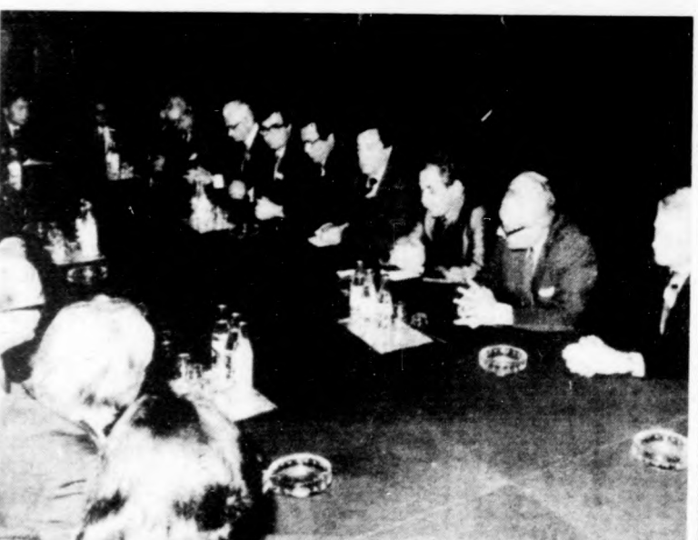
Aczél György miniszterelnök-helyettes a Parlamentben fogadta a szocialista országok egészségügyi minisztereit

Khalafnak, ismertebb nevén Abu Ijadnak az irodája volt. A terrorista akcióért felelősséget vállaló csoport, a „Libanonnak az idegenektől való megszabadítására alakult front” legutóbbi közleményében kilátásba helyezte, hogy szíriai és palesztin vezetők ellen hajtja végre a soron következő merényleteket. A terrorista csoport mögött — baloldali vélemények szerint — az izraeli titkosszolgálat és a vele együttműködő libanoni falangista milíciák állnak.