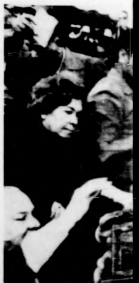
Az egyiptomi parlament elnöke elnökletével a törvényhozásban a tük össze (Telefotó)

A kongresszus az órákban ért végzettségű több — tartalmú — határozatokat, amelyek közül a legfontosabb a keresztyánok alapvető nemzeti kultúrájának megerősítése, a „Szolidaritás” zölközésének támogatása, a „Szolidaritás” zölközésének támogatása, a „Szolidaritás” zölközésének támogatása.