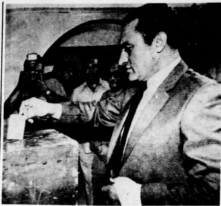
Kedden népszavazást tartottak Egyiptomban. Képünkön: Mubarak eddigi alelnök adja le szavazatát — a várakozás szerint ő tekinthető a meggyilkolt Szadat elnök utódának

DZSIDDA (AP). Richard Nixon volt amerikai elnök kedden befejezte háromnapos látogatását Szad-Árabidában. Megbeszéléseiről sem Nixon, sem pedig szövívője nem nyilatkozott. Nixon Szadot temetése után Kairóból érkezett Dzsiddába és onnan kedden este Jordániába.