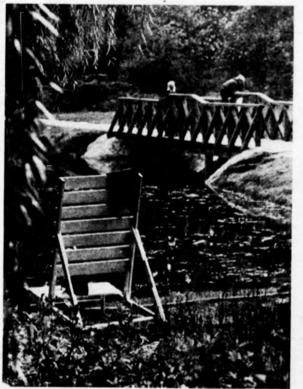
Levél fedte vitzükör

Itt van az ősz. Az elmúlást, mégis megújulót jelző. Csodáit, titkait, káprázatos hangjait, simogató langyosságát teli tudóval szívjuk magunkba. Melegítőül a hideg, zord téli napokra.