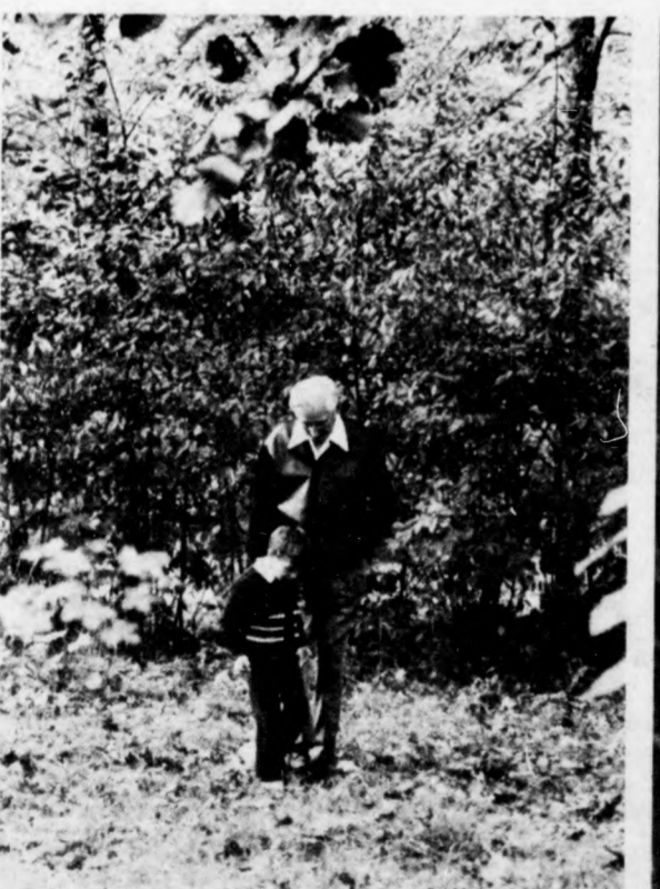
Mi mozog az avarban?