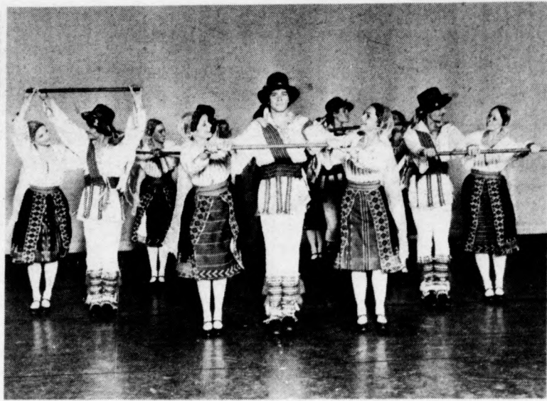
Román tánc az együttes előadásában