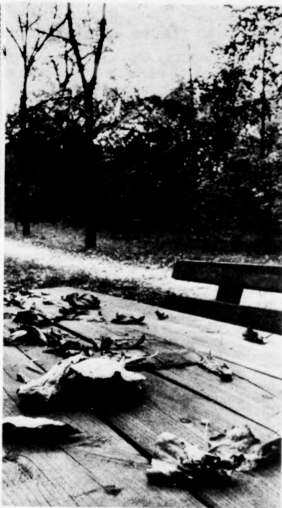
Ritkulnak a lombok