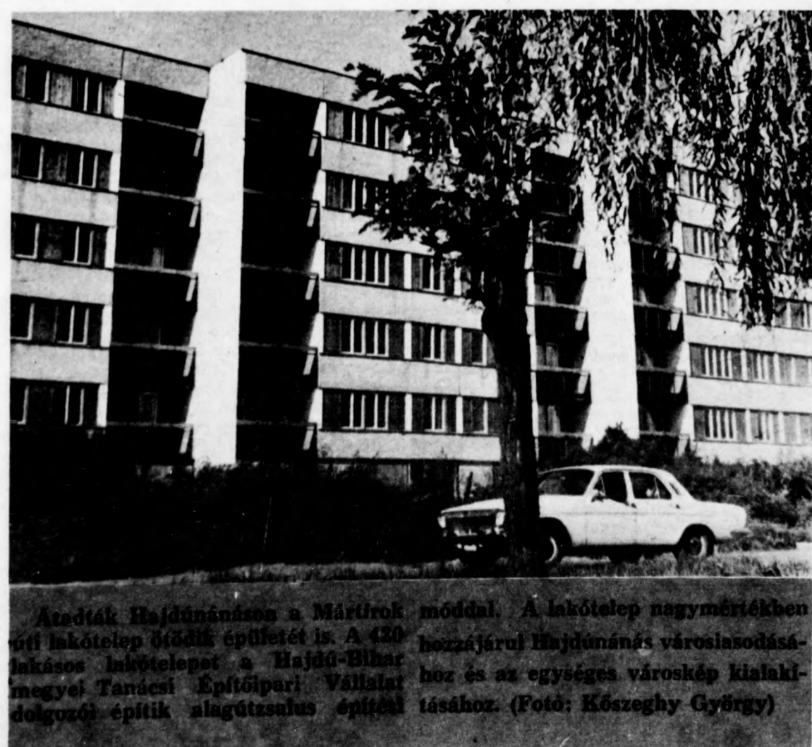
Átadták Hajdúnánásban a Mártírok utcáján a lakótelep nagyméretű épületét is. A 420 lakásos lakótelepet a Hajdú-Bihar megyei Tanács Építőipari Vállalat dolgozói építik alagútszalag építési módszerrel.