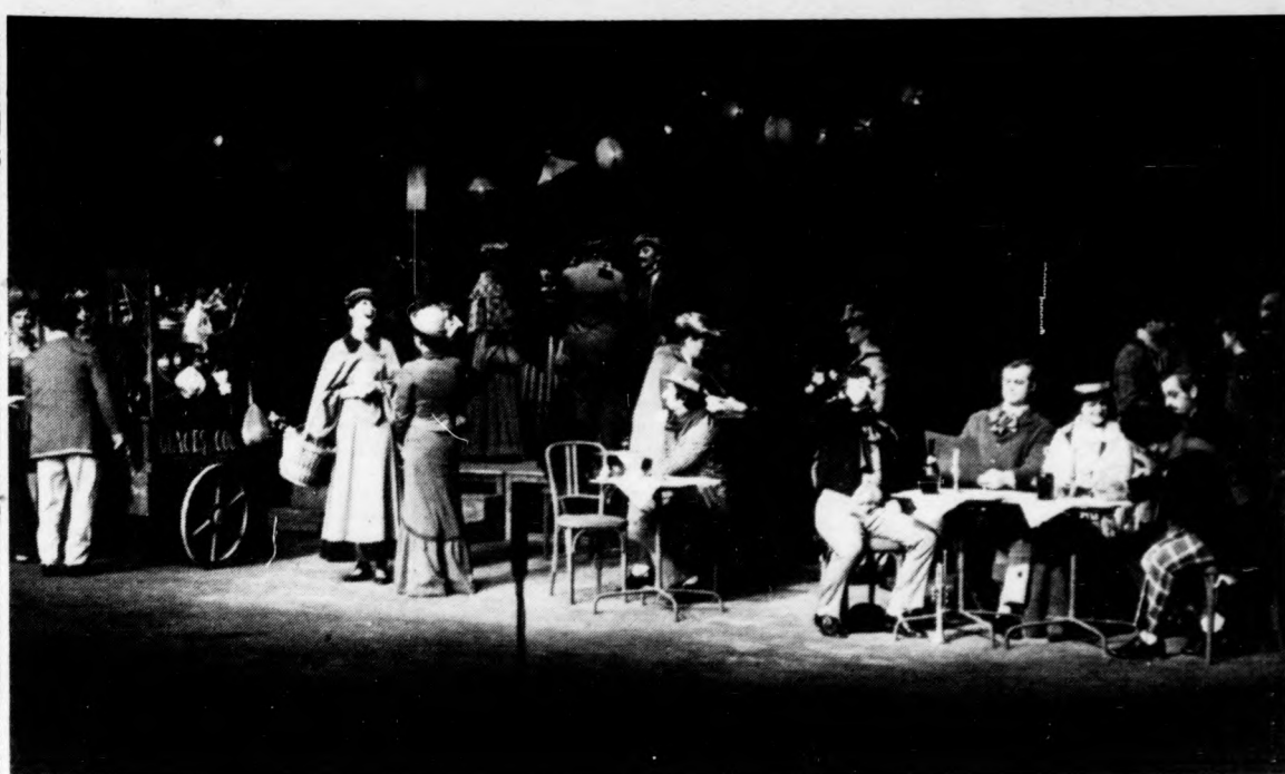
Hamisítatlan párizsi hangulat a színpadon