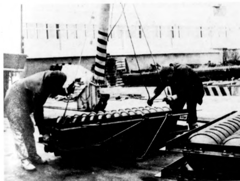
Talajművelő hengerek szállításra készen