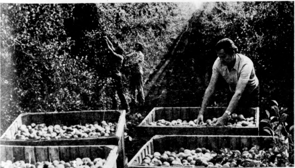
A Tokajhegyaljai Állami Gazdaság Borkombinátjának 4-es számú tarcali kerületében a tájkörzet egyetlen almásában jó hozamra számíthatnak. A kétszázharminckett hektáros területéről várhatóan kilencszáz vagonnai almát szüretelnek, amelynek nagyrészt exportálják.