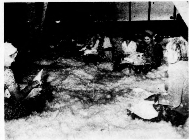
Megkezdődött a libatépés — 200 mázsa tollat értékesítenek