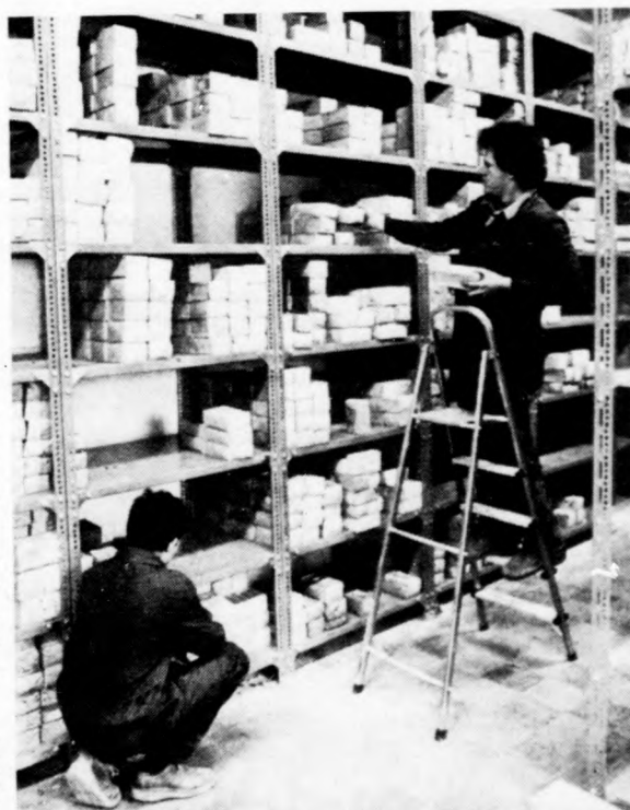
A hétfőn megnyitott csavarszaküzletben nagyobb mennyiségű árut előjegyzés alapján is értékesítenek

Hétfőn, november 2-án, a Mikepércsi úton nyitják meg a vidék első csavarszaküzletét. Egy régi üzletet újítottak fel a Debreceni Építőipari Szövetkezet szakemberei. A gyártó ipari üzemmel közösen működtetett bolt berendezésénél a kirendeltség Kossuth, Garin, Lendület és Rákóczi szocialista brigádjai 400 óra társadalmi munkát végeztek. Az üzletben fa- és lemezcavarakot, saszseget, alátéteket, anyacsavarakot kínálnak, az árukészlet értéke meghaladja a 3,5 millió forintot.