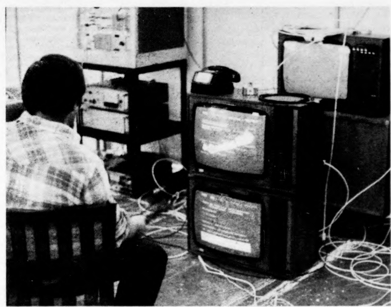
Felvételünk a teletext hazai „próbaüzemén” készült. A Budapesti Nemzetközi Vásár közönsége előtt épp az időjárás-jelentésnél „lapozták fel” a tévéújságot

A televíziózás eme új módjával kísérletező szakemberek felfedezték a „visszacsatortant” is, annak útját-módját, hogy a nézők hogyan