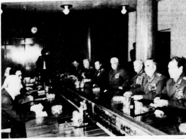
Kádár János fogadta a Varsói Szerződés tagállamai egyesített fegyveres erők katonai tanácsának tagjait

Kádár János, a Magyar Szocialista Munkáspárt Központi Bizottságának első tit-