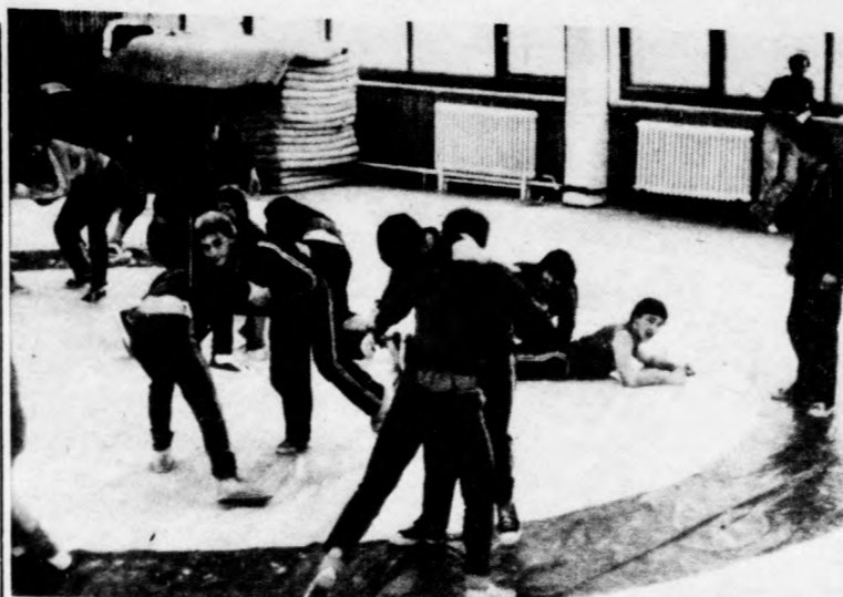
Felvételünk a DMVSC csapatbajnokság előtti utolsó edzésén készült