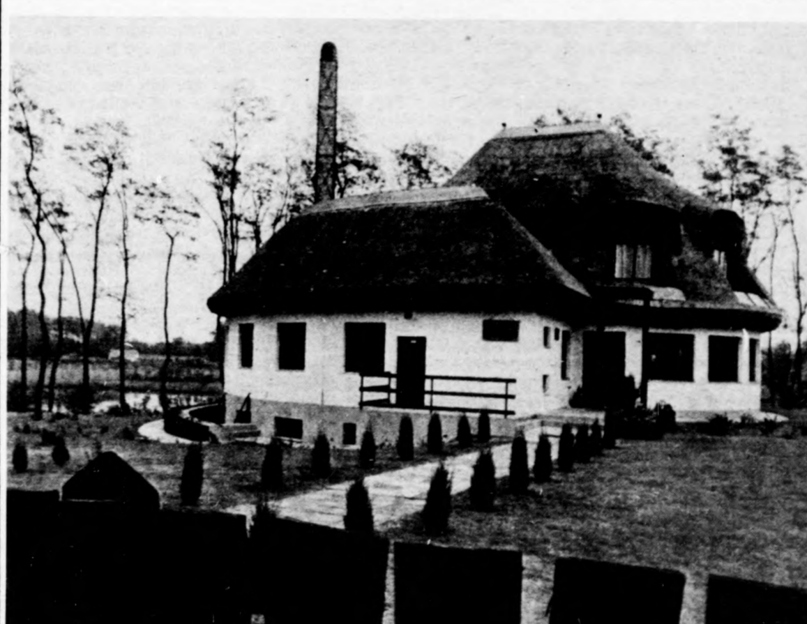
Ahogy beszámoltunk róla, Debrecen felszabadulásának évfordulóján avatták fel a város határában az Erdős puszták legújabb létesítményét, a bányai bemutatóházat. A panorámaút mellett található tájhoz felvételünk tanúsága szerint is jól illeszkedik a tájba. A Debreceni Erdős puszták Intéző Bizottságának programja szerint a bányai rész alapvető funkciója a korszerű, tudományos ismeretterjesztés, az oktatás és a kutatás. Ezt a célt szolgálja a tájhoz, hisz a gyűjteményben szerepelnek a vidék múltjának emlékei, s bemutatják a táj élővilágát is. Tovább bővíti a következő években az ismeretterjesztés lehetőségeit a tájhozhoz kapcsolódó szabadtéri bemutatórész és a kialakítás alatt álló fűvészkert és arborétum.