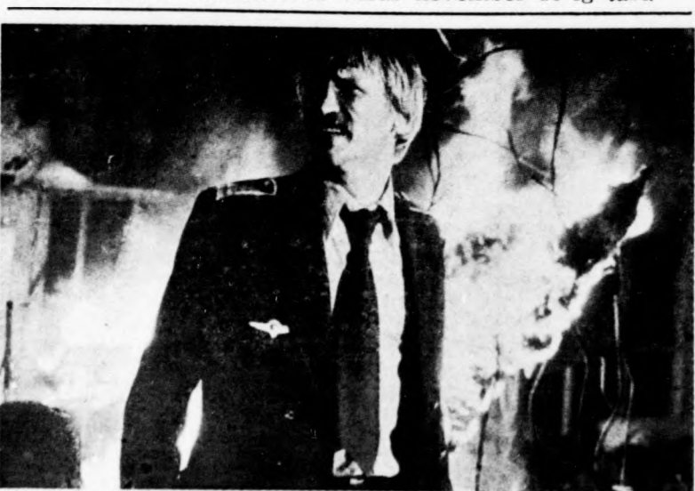
KATASZTRÓFA FÖLDÜN-EGÉN I-II

Az elmúlt évi sikeres bemutatkozás után a Hajdú-Bihar megyei Vendéglátó Vállalat ebben az esztendőben is megrendezi a Hajdú-Bihari gasztronómiaért elnevezésű izéparádét. A november 29-ig tartó eseménysorozat elején cukrászati kiállítás és vásár nyitottak meg november 11-én a debreceni Aranybika Szállóba üvegtermében. A süteményeket, édességeket kedvelők számára mintegy százféle finomságból nyílik választási lehetőség, ugyanakkor a szálloda halljában megtekinthetők a főként vendéglátóipari szakköz-péjskolások által megterített díszes asztalok is.