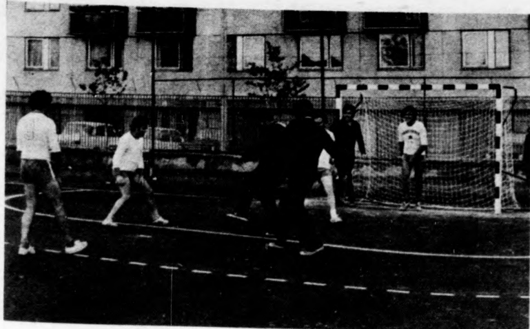
Új kézilabdapálya a pártiskolán