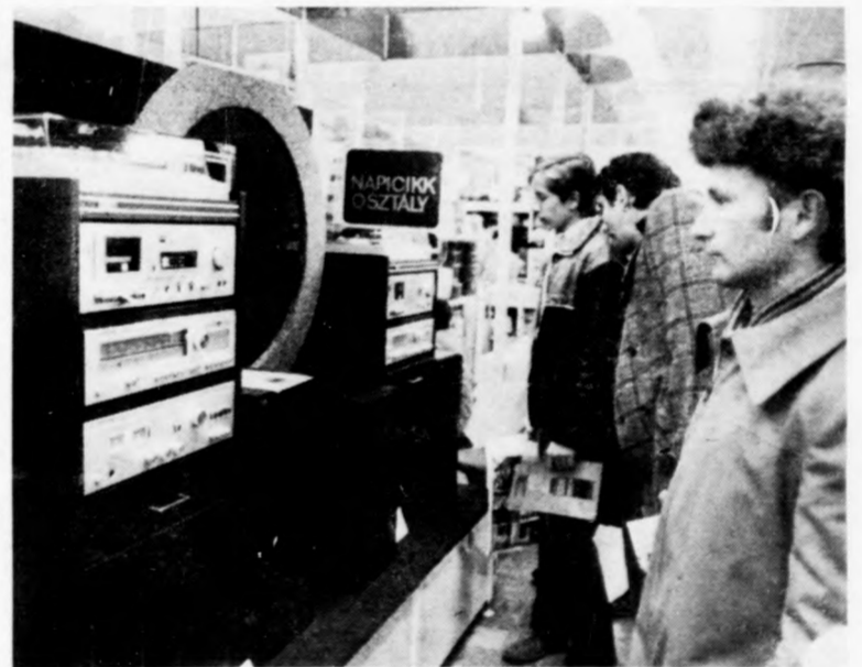
Nagy sikert aratott a hi-fi torony, órák alatt megvették a távirányítású színes televíziókat